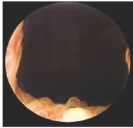
▲經綠光攝護腺氣化術後通 道變大，排尿順暢。

當病情加重，病人無法忍受或有下列情況時(血尿、尿路發炎、膀胱結石、急性尿阻塞，或腎功能受到影響)可考慮手術治療。TURP 是目前最常用於治療 BPH 的方式，利用電刀經由尿道將攝護腺組織一片片刮除。對於嚴重影響到生活品質、藥物治療效果不佳的病患，因能立即解除症狀，故仍是目前最有效的方式。手術後的副作用包括：術後出血、感染，少數病人會有術後陽萎或尿失禁的困擾。