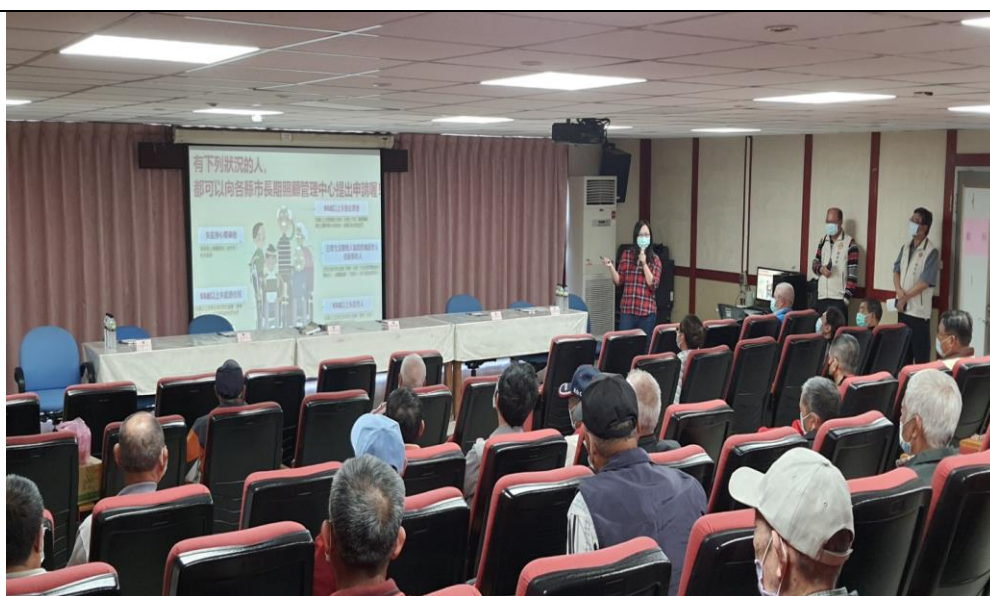
相片主題(2)：金門縣衛生局長照中心健康長照 2.0 宣導