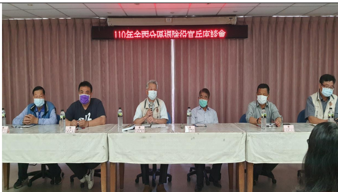
相片主題(4)：處長回復榮民所提出問題及建言