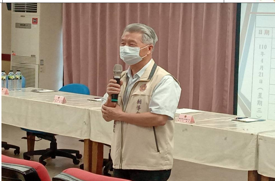
相片主題(1)：處長致詞歡迎與會來賓及感謝榮民(眷)撥冗與會