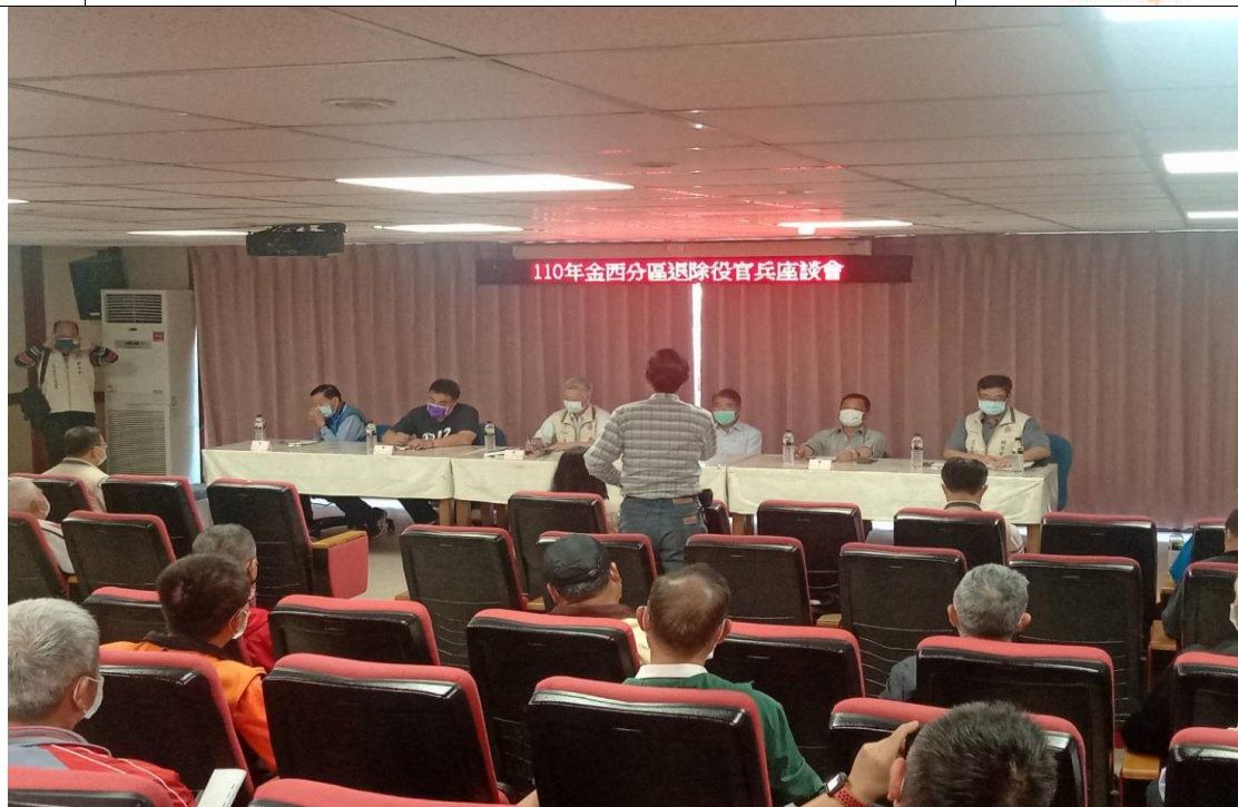
相片主題(3)：與會榮民提出建言