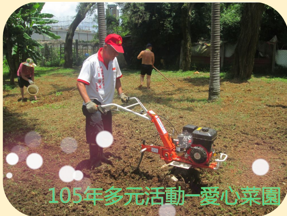
105年多元活動-愛心菜園