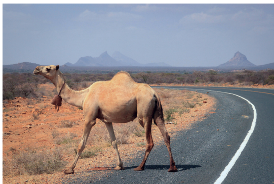
在沙漠的公路上常常可以看到的駱駝。

一日，我們駐沙的三、五家好友，早上七時驅車由沙京利雅德出發，車程約需四小時到東部的達蘭海邊遊玩，主要目的是撿拾各式各樣的貝類，食其肉留其殼，因種類繁多，我喜愛整理收集，阿拉伯人因不食帶殼海產，龍蝦、螃蟹甚至大隻的石斑魚，因鱗片明顯都拒絕食用，那大而全身柔軟的海鰻，他們連捕捉都不敢，海中常見的烏賊、章魚等軟體海產也不享用，但是漁船在紅海捕魚時，常有上述海產被捕，在漁市場特殊的一角販售，且價格低廉。以一袋約十五隻的龍蝦為例，才賣沙幣三十元（約臺幣三百六十元），如果討價還價，可能只要二十元，真便宜了我們這些駐沙的外國人！本段的主題其實是我們早上在往達蘭的途中，看到一隻體型頗大的駱駝，橫躺在高速公路旁的護坡上，顯然受到了重撞，沙國人少、車少，高速公路是大家超