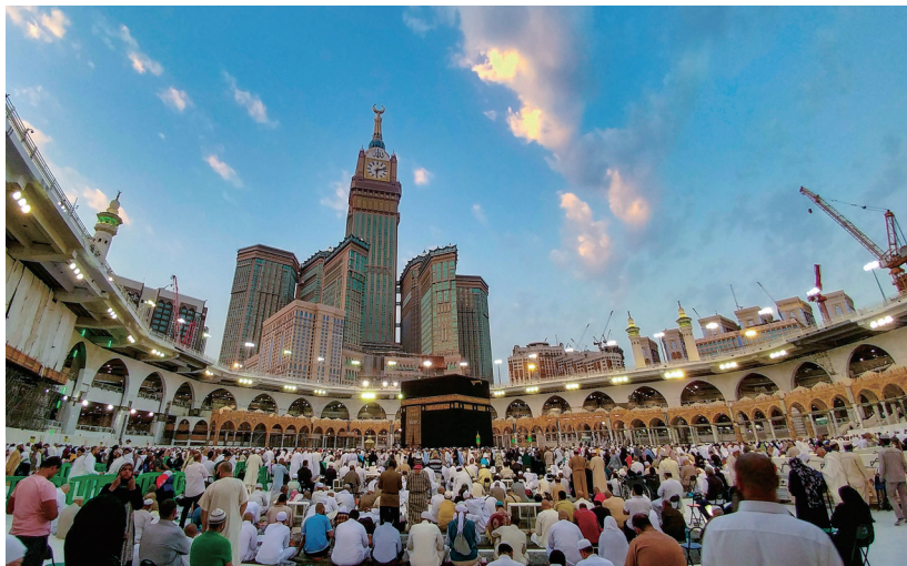
沙烏地阿拉伯麥加是回教徒禮拜和朝覲的聖地。

主任委員曾在民國七十一年至七十四年擔任駐沙烏地阿拉伯副武官，偶爾會在「大鵬隨筆」分享期間的所見所聞，這是主委的第一篇。民國三十五年十一月十五日中華民國與沙烏地阿拉伯王國簽訂友好條約，建立領事級外交關係，一直持續到民國七十九年，是中东地區最後一個與中華民國斷交的國家。斷交後，互在對方首都設立具大使館性質的代表機構，關係長期友好。