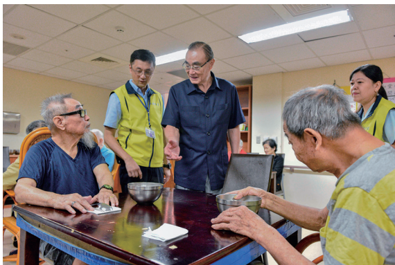
榮民長輩都是我們的親人。