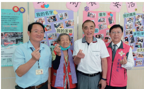
我心中以關切榮家住民的生活福祉為首務。