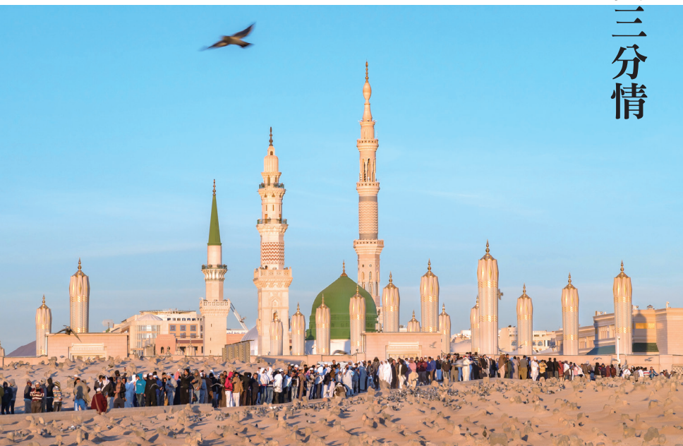
篤信回教的沙烏地阿拉伯，清真寺林立。

主任委員豪氣干雲的真性情，而且能夠入境問俗，非常融入當地生活，因此，在沙烏地阿拉伯王國可說揮灑自如。這篇〈見面三分情〉描繪了主委在酬酢飲食之間，與沙國軍方往來的諸多情節，乍看好像只是生動有趣，其實是圓滿達成任務於無形，難怪主委會這麼說：處處留心皆學問，在沙國用之無處不利！