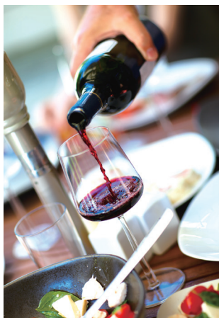
喝酒是沙烏地阿拉伯禁忌之一。