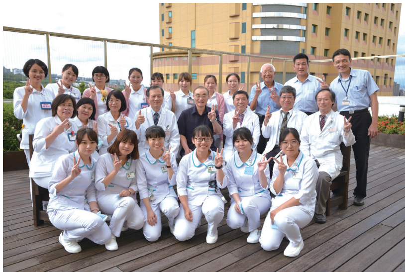
我為默默付出的醫護人員加油打氣。

主任委員接掌退輔會之後，發現所服務的三十餘萬榮民之中，有七萬多人超過九十二歲，估計全國三千多位百歲人瑞之中，榮民就占了七百多位，因此提供優質的醫療照護服務，對榮民（眷）弟兄至關重要，每每在視導榮院體系時總不忘叮嚀再三，另一方面，主委也非常體恤醫護人員的耐苦、耐勞、耐煩，在這一篇〈杏林傳聲〉寫出了對醫護人員滿滿的關懷，並籲請大家對他們：多點微笑、愛心、包容與鼓勵吧！