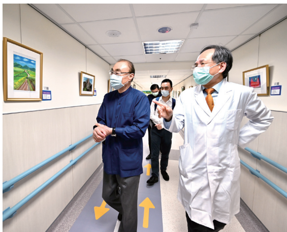
我參觀榮院藝文展覽。

今年或許因疫情影響，重症病患留院過年的增多了，北榮在除夕當天就有多起送急診後進加護病房的，當他們的家人在團聚會餐時，而我們的醫護人員忙得連晚餐都沒時間吃呢！