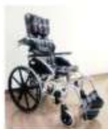
高背特製輪椅(空中傾仰型)