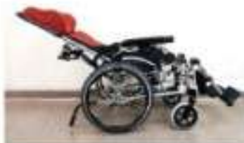
高背特製輪椅(傾仰型)