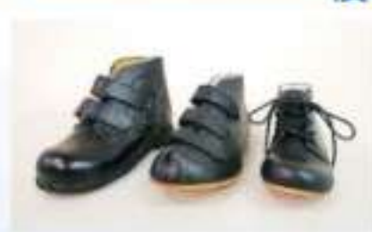
足部護具(特製矯型皮鞋)