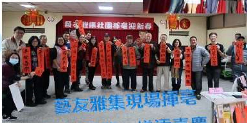
藝友雅集現場揮毫