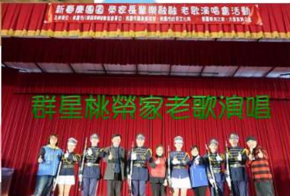
群星桃榮家老歌演唱