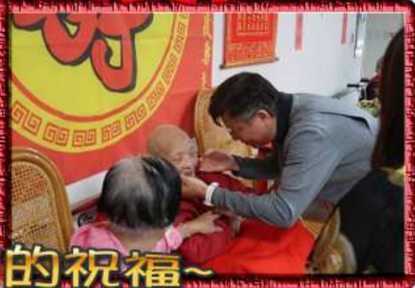
獻上各級長官的祝福~