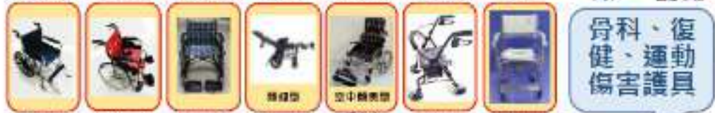
不銹鋼輪椅 鋁合金輪椅 特製輪椅 高背特製輪椅 鋁合金高背特製輪椅 動力車 洗澡便盆專用椅