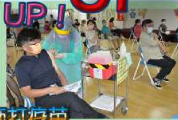
家主任與住民一同施打疫苗