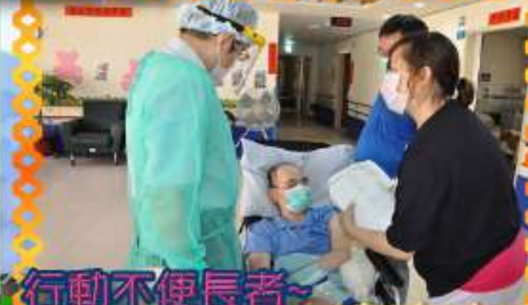
行動不便長者~ 到堂施打就甘心~