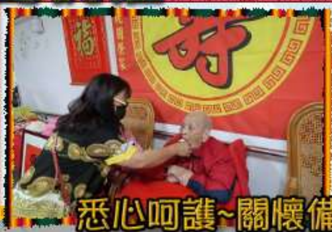
悉心呵護~關懷備至~