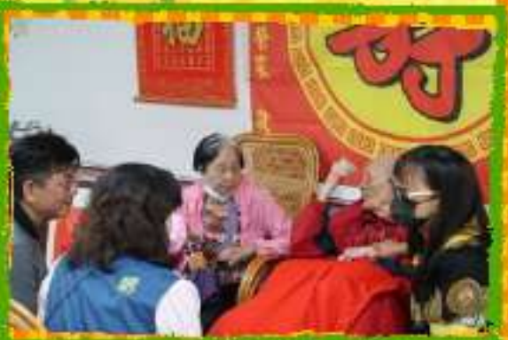
與家屬交流~ 分享照顧經驗~