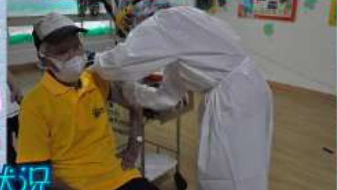
藥師細心問診・評估長輩狀況