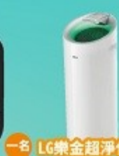
一名 LG樂金超淨化大白 空氣清淨機