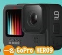
一名 GoPro HERO9