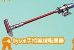
一名 Dyson手持無線吸塵器