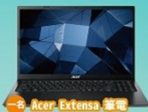
一名 Acer Extensa 筆電