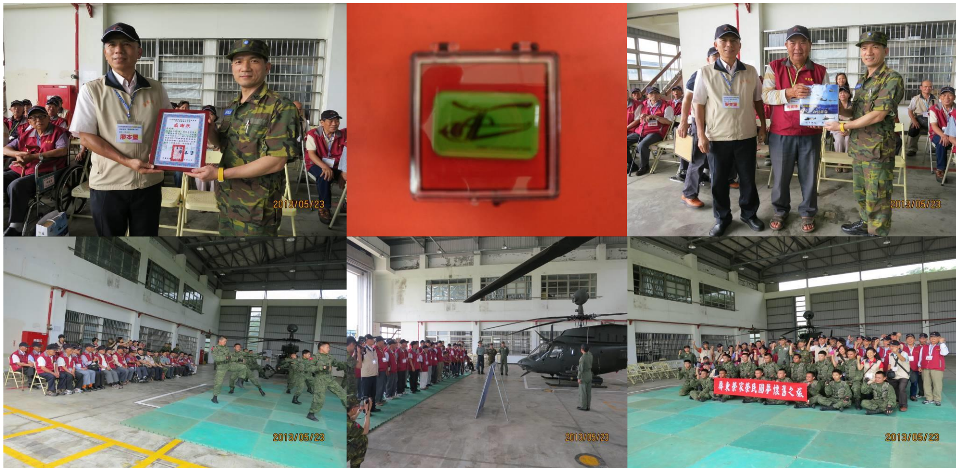
政戰主任侯上校親迎榮民前輩蒞臨，並致贈紀念徽章，榮民參訪陸軍航空 601 旅特戰官兵戰技操演、O、u 型機靜態裝備陳展，家主任特致贈感謝狀乙禎以資謝忱。