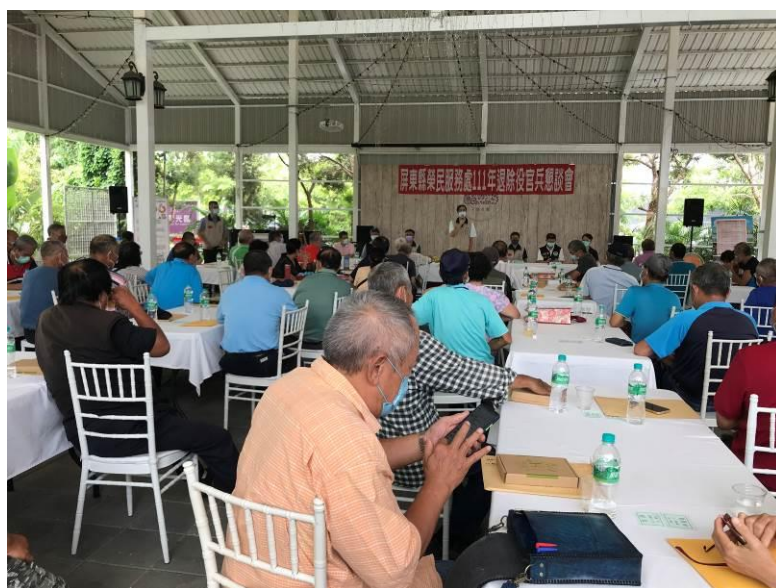
相片主題(1)：處長主持 111 年退除役官兵代表懇談會