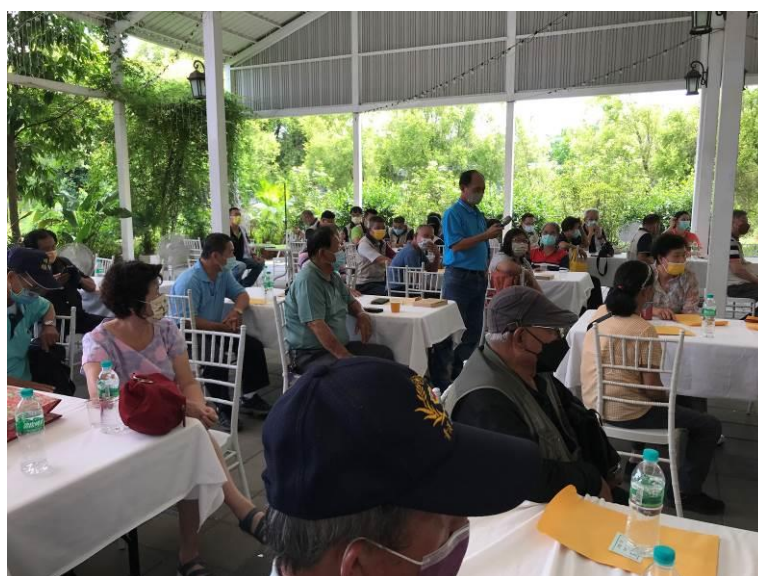
相片主題(3)：與會退除役官兵發表建言