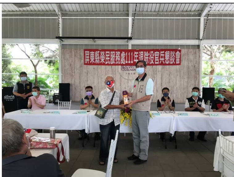
相片主題(4)：處長頒贈退除役官兵代表需用品