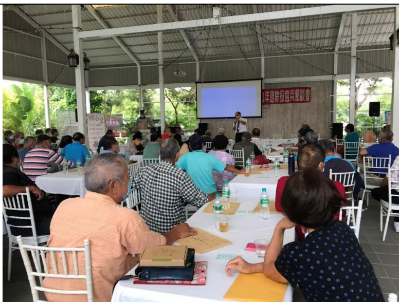
相片主題(2)：金管會講師實施金融教育講習