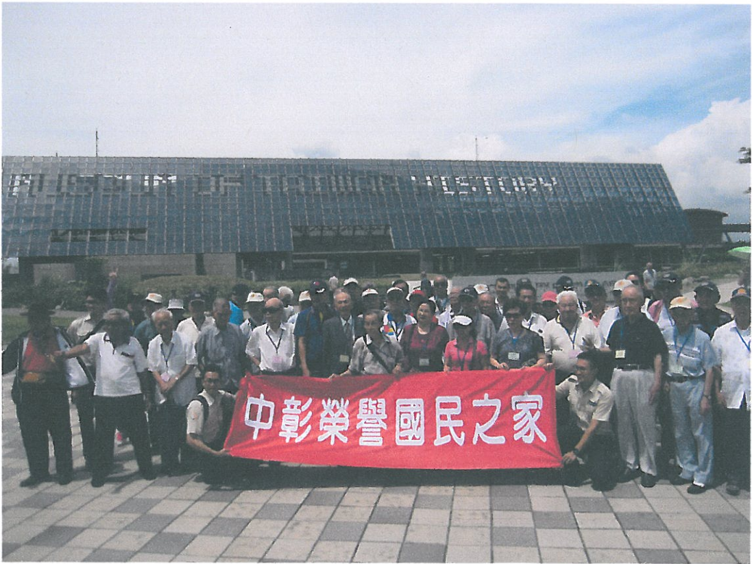
台灣歷史博物館前大合照