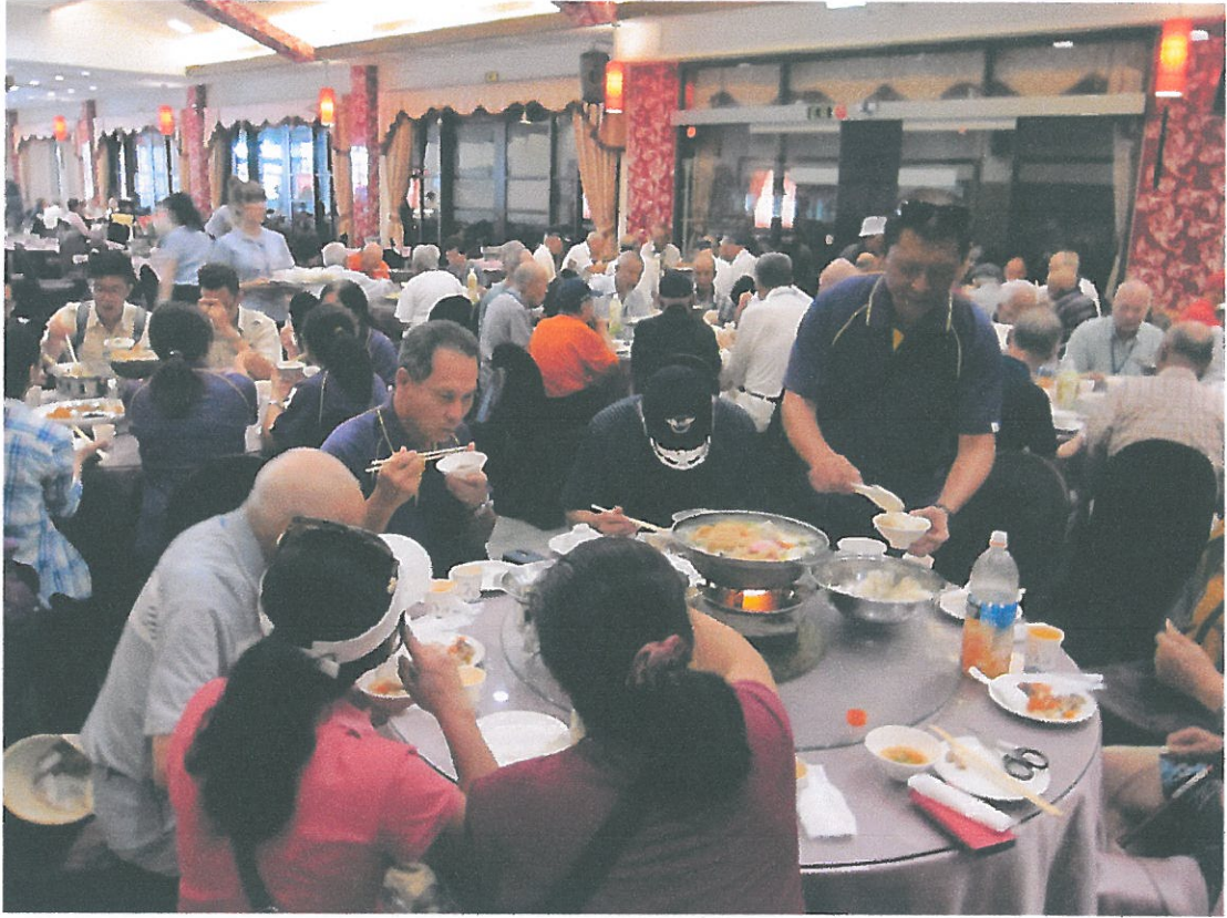
中午享用美味佳餚