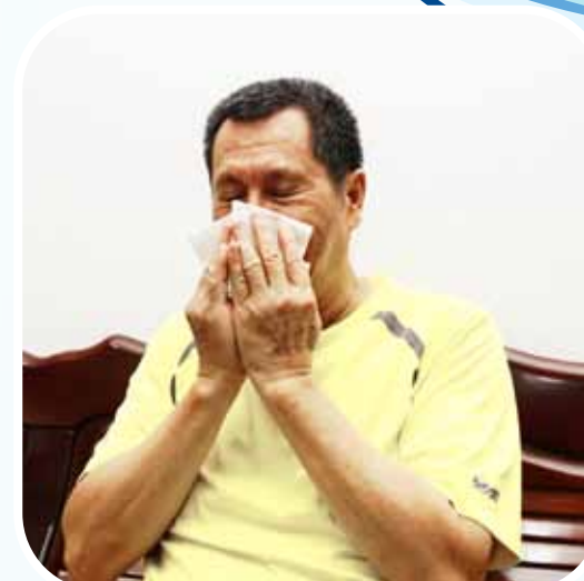
擤鼻涕、咳嗽 或打噴嚏後