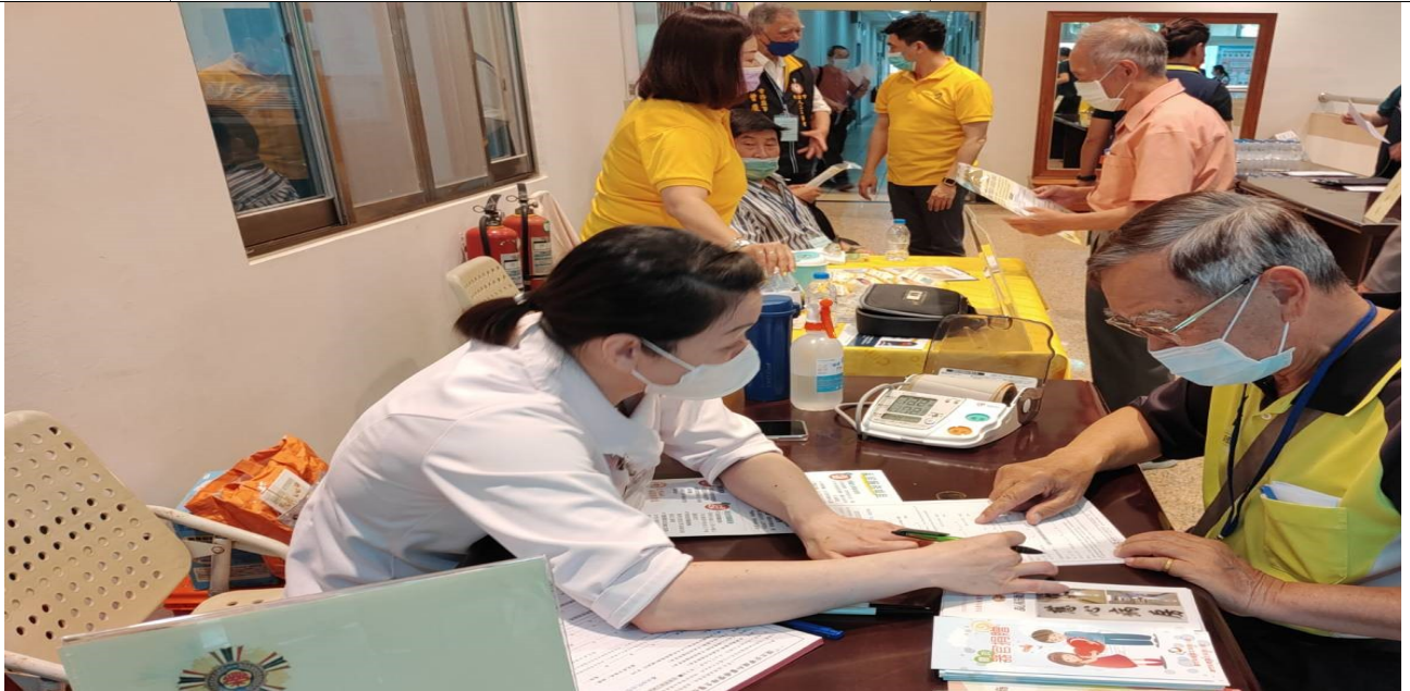
相片主題(1)：桃園分院設立服務台提供醫療諮詢服務