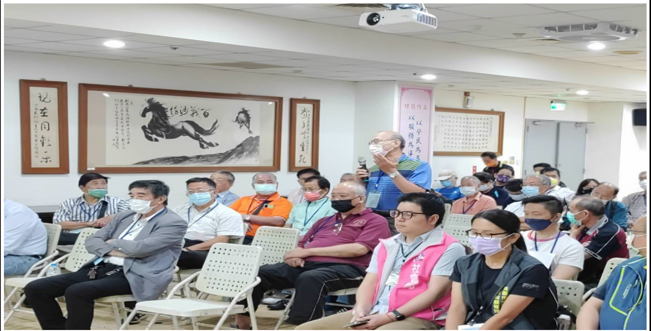
相片主題(3)：榮民發言