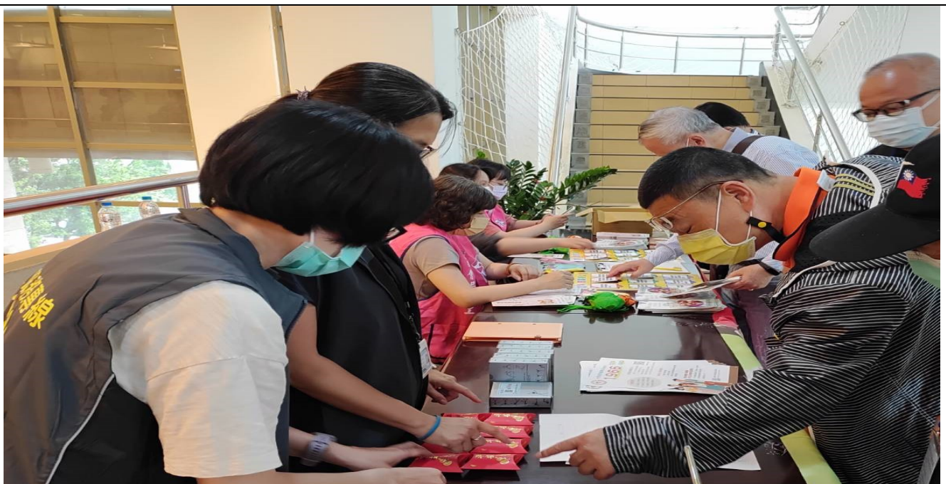
相片主題(2)：桃園市政府社會局設立服務台提供諮詢服務