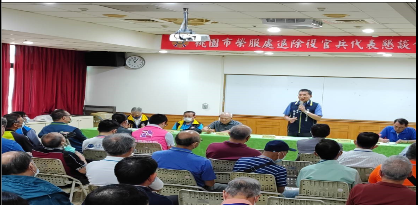
相片主題(4)：處長主持會議及答覆榮民發言