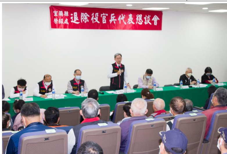
相片主題(1)：處長致詞