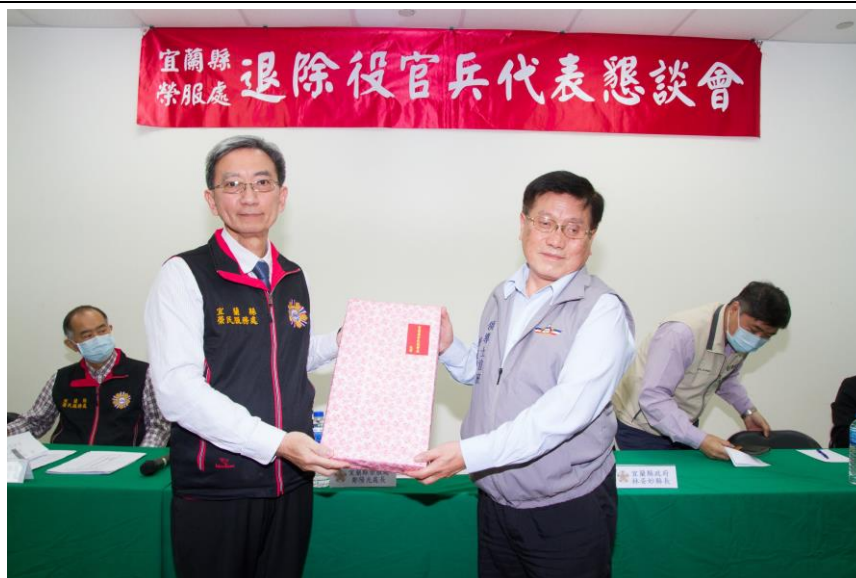
相片主題(2)：頒贈需用品