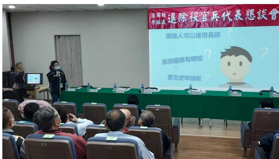
相片主題(4)：長照宣導