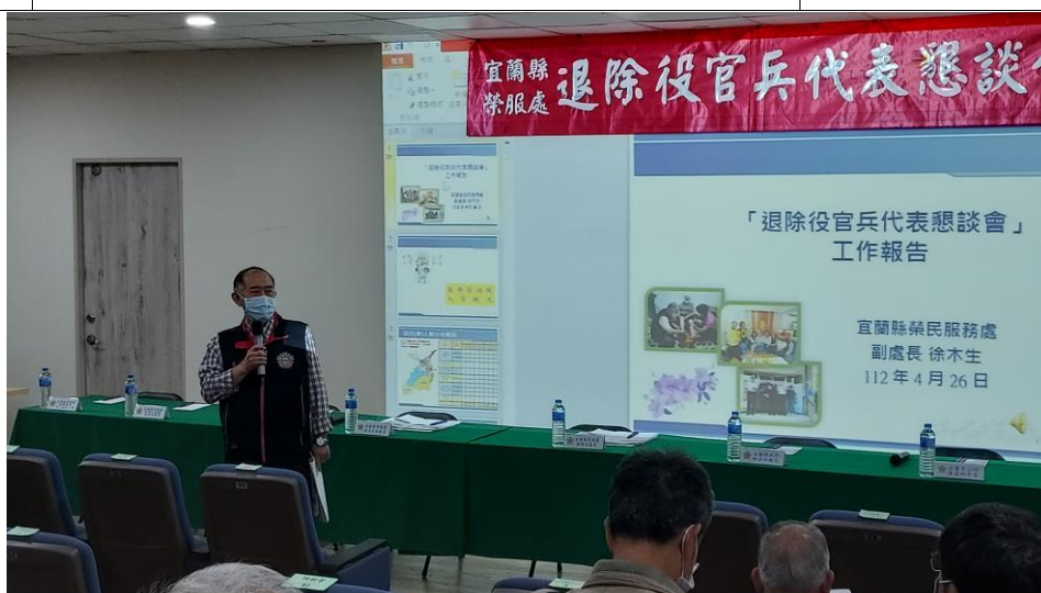
相片主題(3)：副處長本處工作報告