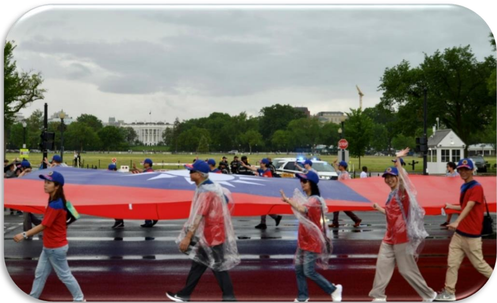
榮僑持舉中華民國巨幅國旗參與美國國殤日華府遊行

(三)配合美國退伍軍人中心舉辦華府「全國國殤日大遊行」，由華府榮光會組成旗隊參加遊行，並邀集我國旅美榮僑、眷屬持舉長達 50 英尺長巨幅中華民國國旗，經由媒體直播呈現於世界各地，凝聚旅外國人團結向心，以宣揚美我兩國為二戰同盟戰勝國史觀。