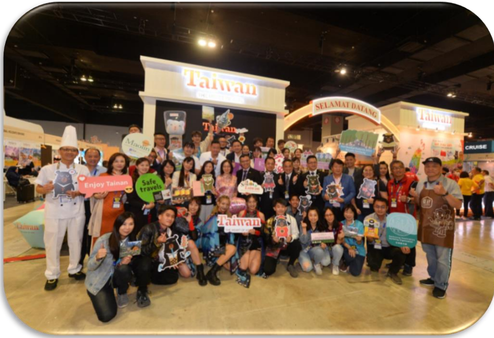
2023 年馬來西亞春季旅展