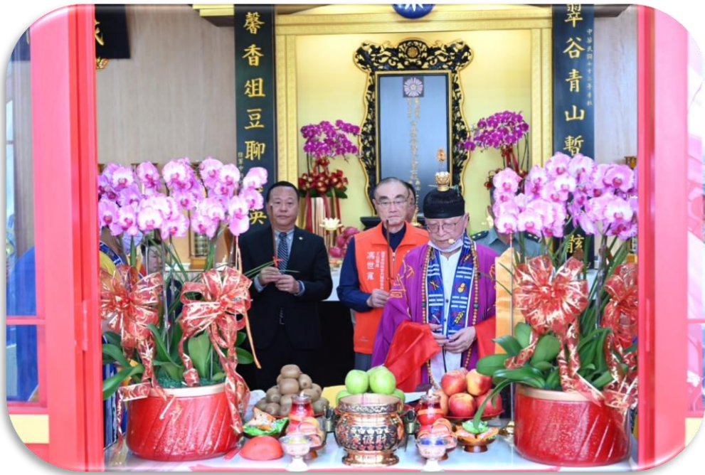
主任委員與國防部柏副部長在臺北榮家榮靈堂前持香祝禱

(八)感念隨政府來臺榮民，終身為國家的自由民主與經濟繁榮犧牲奉獻，奠定國家永續發展基礎，於今年 8 月 23 日假臺北榮家舉辦「隨政府來臺歷年亡故榮靈啟建中元普渡靈寶正一超薦黃籙道場」，祈佑榮靈超生極樂、英靈永安；同時也祈願所有榮家住民長輩健康平安。