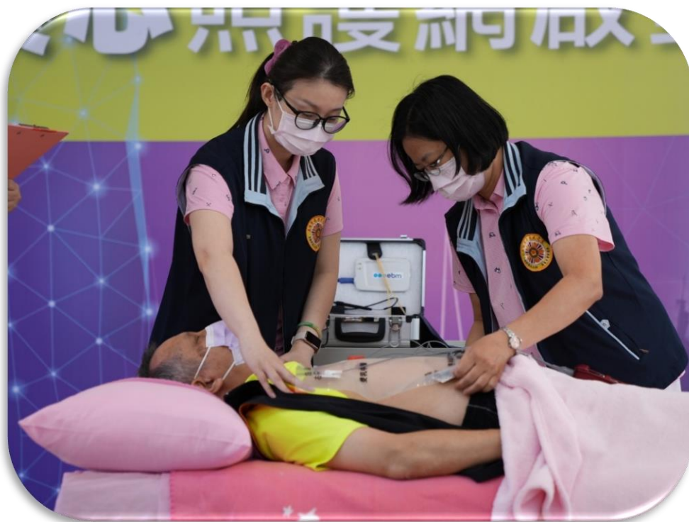
榮心照護網-系統設備演示

(二)為提升榮家心臟病患於黃金治療時間接受治療，高雄榮總將運用在救護車之無線即時傳輸心電圖系統導入榮家，建立榮家與榮院之榮心照護網，運用「定心布-心電圖檢查快速定位裝置」，配合心電圖行動傳輸及自動判讀系統，及早診斷出心臟疾病，讓榮家與醫院提早因應，把握黃金治療時間。自去年於高雄榮家推動，今年已推廣至岡山榮家與白河榮家，預於 3-5 年內推展至所有榮家。