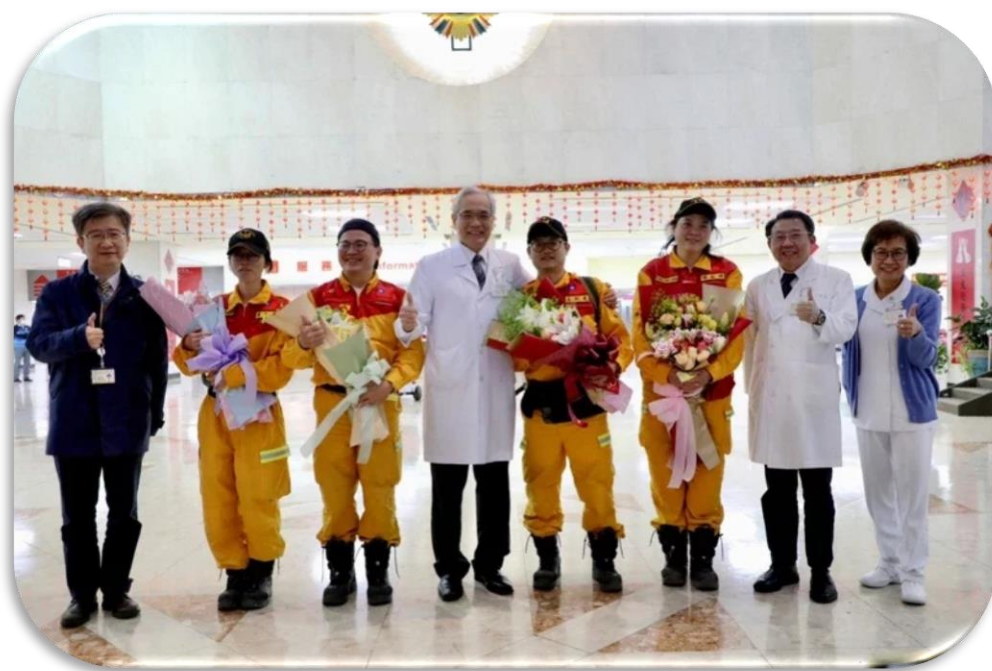
臺北榮總醫護人員隨搜救隊至土耳其救災

(九)拓展國際醫療與學術合作，提升臺灣國際能見度。臺北榮總領導榮陽團隊賡續承接「新南向一國一中心」計畫，深耕新南向國際醫療。各榮總藉簽約建立醫療合作網絡，與國外醫療機構互訪。臺北榮總派出醫護隨隊至土耳其救災，全力支持所需的藥物與器材設備。臺中榮總派遣行動醫療團赴諾魯共和國執行今年度「太平洋友邦醫療合作計畫」；高雄榮總將派遣印尼國際醫療團，執行基層巡迴義診、公共衛教，向國際展現人道服務並鞏固邦誼。