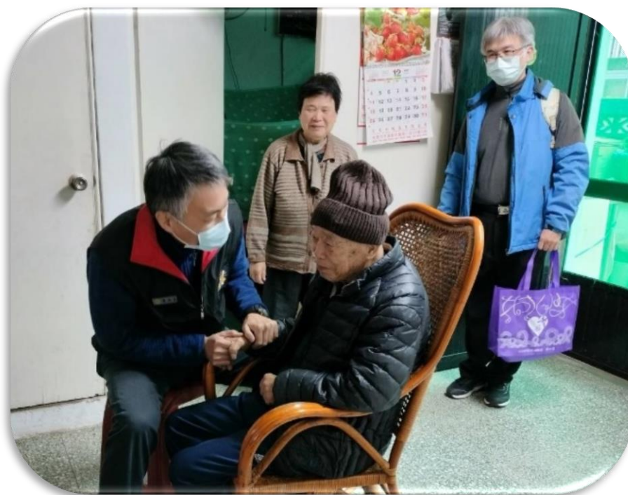
臺北市榮服處關懷訪視榮民

(二)定期訪視關懷退除役官兵(眷屬)，運用科技輔具(遠距居家照護系統)，或與村(里)長、鄰居、榮欣志工等建立橫向聯繫，發掘個案問題轉介妥處，今年1-8月計服務82萬4,040人次。