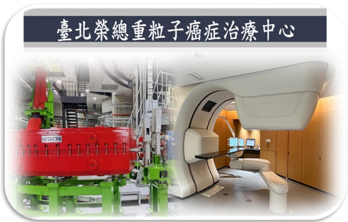
臺北榮總重粒子癌症治療中心內部設備

(六)全國首座臺北榮總重粒子癌症治療中心於今年5月15日正式營運，具療程短、對快速生長或特定的腫瘤(如肺癌等)有極佳療效及精準定位降低副作用等3大優點，大幅節省病患治療時間及成本。臺中榮總籌建質子治療中心，可有效治療頑強之腫瘤及降低副作用，提供病患最先進的精準放射治療。