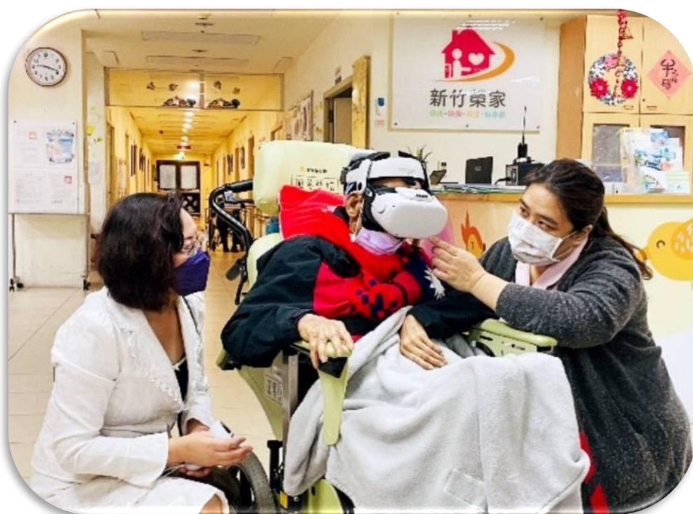
新竹榮家透過沉浸式 VR 科技一圓養護住民重遊故鄉美景心願

(二)推動「榮莒案」，藉由定期專業講座，促進和諧的性別關係，並透過多元活動及空間布置，鼓勵自然交流互動，充實住民晚年生活。目前桃園等5所榮家試辦導入 VR 虛擬實境設備，除協助長輩身心需求外，應用智能科技，滿足多元需求，如：3D 立體遊戲、互動影片體驗、思鄉旅行或賞遊城市等，共創長輩幸福健康的暮年時光。