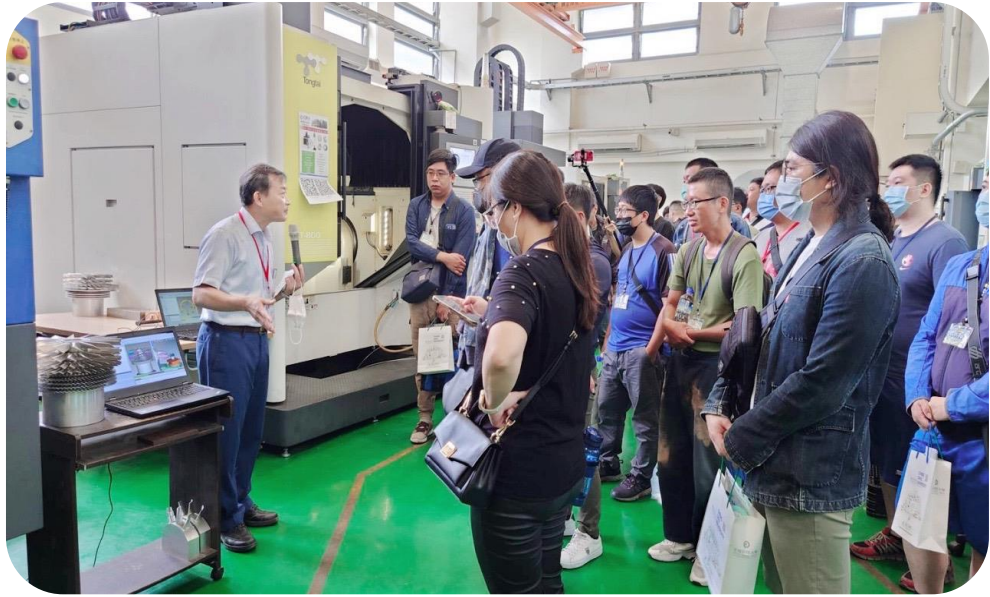
退除役官兵參訪正修科大產學專班(電機工程系)