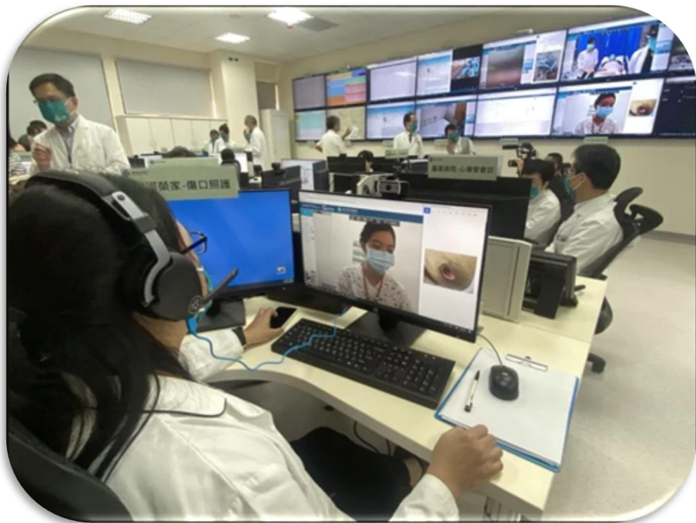
臺中榮總成立遠距照護中心

(三)推動「榮總榮家急診遠距醫療品質提升計畫」，提供榮家住民遠距會診與醫療諮詢服務，減少榮家住民外送就醫。自110年10月至今年8月，服務計1,219人次，其中419人次建議續留榮家觀察，減少轉送醫院比率達34.37%。