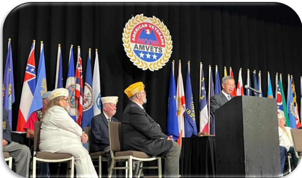
簡主任秘書於「美國退伍軍人協會」大會致詞