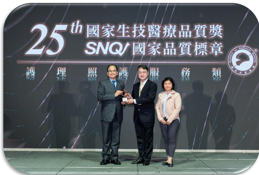
臺北榮總玉里分院附設精神護理之家獲國家生技醫療品質銅獎