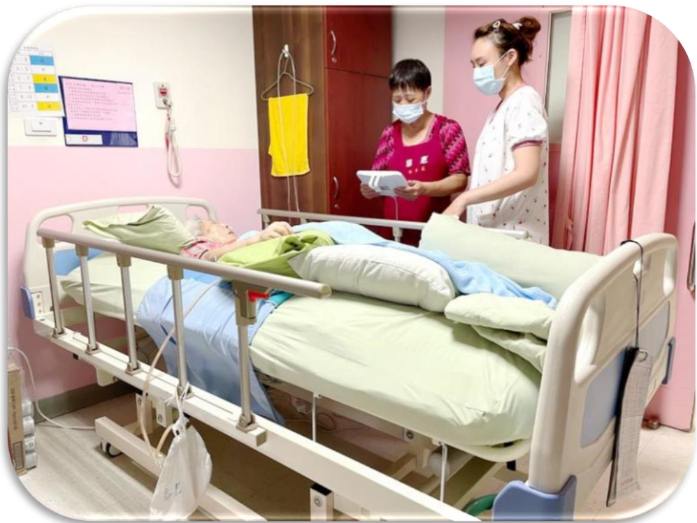
雲林榮家引進自動翻身床，降低住民褥瘡發生機率

(三)榮家配置生命體徵自動上傳照護系統，即時監測、掌握住民生命徵象及血壓，數據自動上傳，有效提升照護效率。目前桃園、新竹、彰化、雲林、白河及岡山等 6 所榮家，引進自動翻身床，減少照服員日常照護作業造成的職業性肌肉骨骼傷害，並能降低長期臥床重症住民壓瘡發生機率。