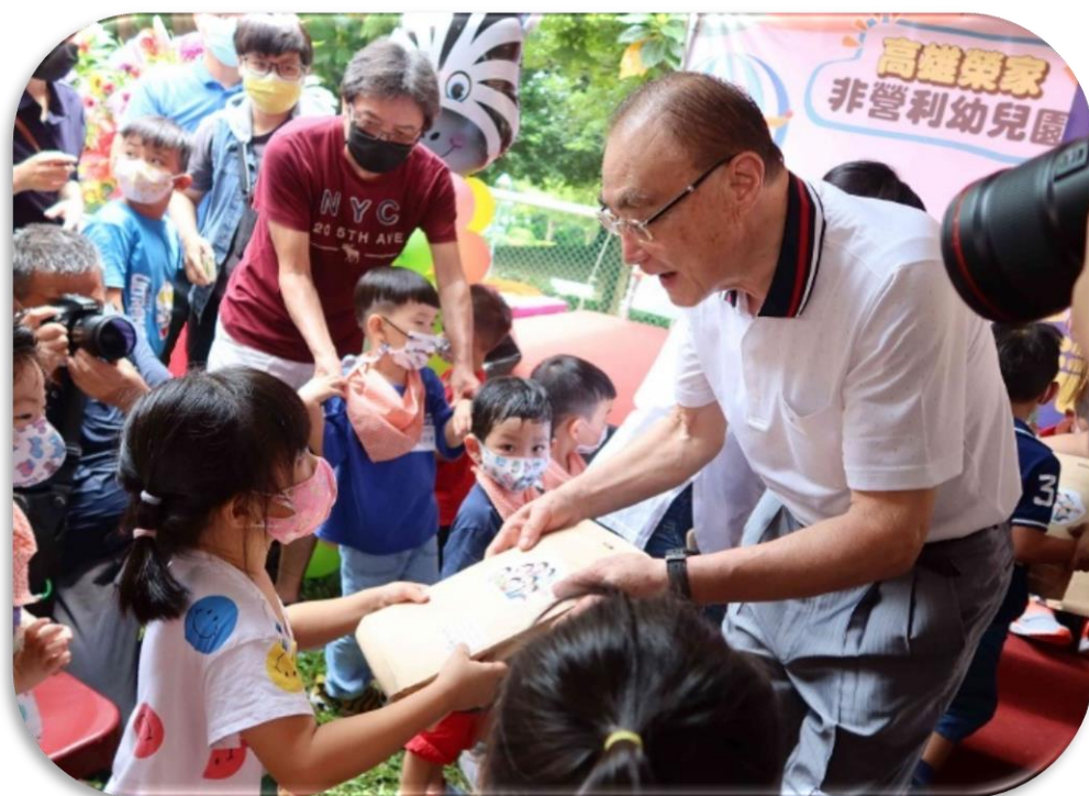
主任委員致贈高雄榮家非營利幼兒園學童開學文具

(一)於高雄、花蓮及馬蘭榮家設置非營利幼兒園及職場教保中心，收托 6 歲以下幼童；並開放家區公共空間及綠地，邀請鄰近幼兒園、小學等青年學子進入家區，促進互動、老幼共融。另榮家進行家區交誼空間優化，如桃園榮家打造逆齡咖啡館、誠樸茶軒及戶外窯烤區等，提供住民多元活動場域，增加人際互動，促進身心健康。