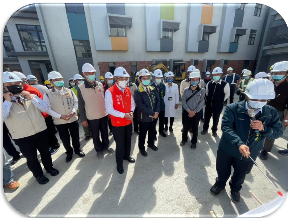
主任委員與臺南市黃偉哲市長視察臺南榮家新建進度

(二)臺南榮家新家區設施環境總體營造，採用先進國家「團體家屋」照護單元、「簇群式聚落」模式設計，營造人性化、居家化溫馨感、生態綠化等特色。遷建工程於年底陸續竣工，並逐步進行驗收及搬遷作業，屆時結合高雄榮總臺南分院，落實「醫養合一」目標，提升榮家服務效益，帶動臺南市的都市新氣象。