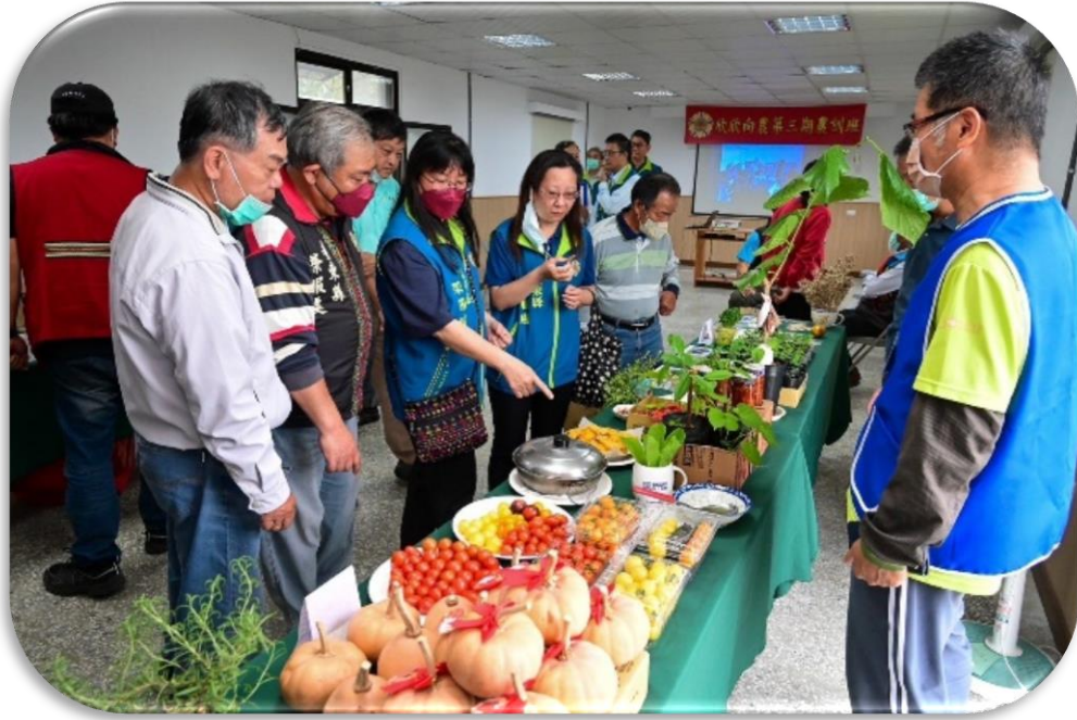
欣欣向農第三期學員成果展示

(五)開源節流，提升經營獲利，透過董事會及工作會報督導各轉投資公司經營狀況，今年1-7月主要轉投資事業稅前盈餘33億7,856萬餘元，全年目標達成率67.07%，較去年同期增加2億1,140萬餘元，持續提升營運績效，走向永續經營。