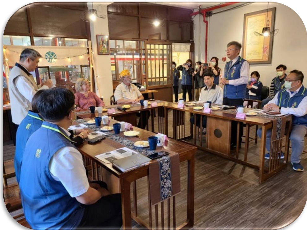
美國退伍軍人協會麥克萊恩總會長伉儷參訪桃園榮家 走訪家區 12 項幸福建設

(五)榮家積極與社會及國際接軌，美國退伍軍人協會麥克萊恩總會長伉儷參訪桃園榮家，走訪家區 12 項幸福建設，體驗榮家優質老人照護實況。歐盟