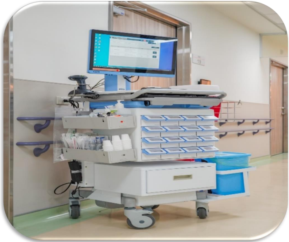
屏東榮總智慧藥盒系統

(五)各榮總整合並促進榮民醫療體系癌症免疫細胞治療與再生細胞治療研究，已進行臨床試驗申請。另由臺北榮總建構「臨床用等級細胞分選培養擴增系統 (CliniMACS Prodigy)」，使各榮總據以建立細胞治療中心，發展骨肉瘤、肺癌、頭頸癌之癌症細胞免疫治療，長期目標為推動臺灣成為亞太癌症細胞及免疫、再生醫療產業樞紐。