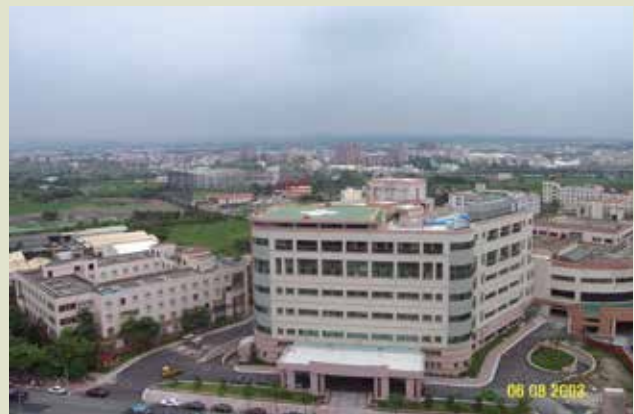
高雄榮總急診大樓。