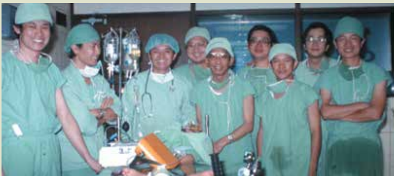
我國第1位兒童肝臟移植醫師團隊。