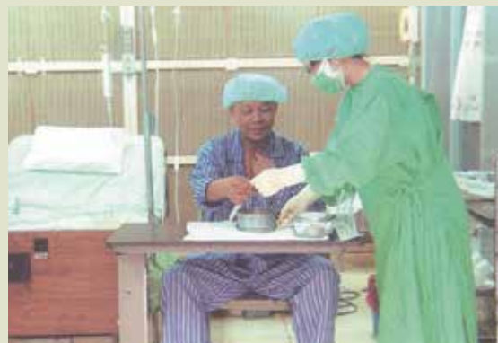
國內第1位接受非親屬間骨髓移植者在病房恢復中。