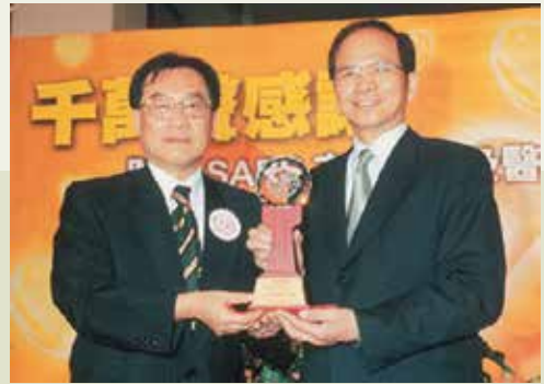
李院長（左）代表臺北榮總受獎。