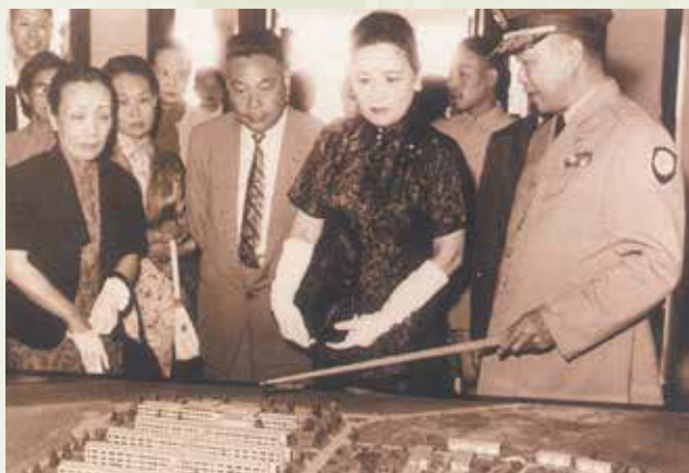
民國48年11月蔣夫人巡視本院盧院長(右1)簡報。

盧院長畢業於北平協和醫院，並先後到英、德、美、加等國進修，見聞廣博，學養俱深。除擔任國防醫學院及北榮院長外，並曾任中研院院士，中華民國紅十字總會會長等重要職務，實為臺灣醫療史上重要人物。