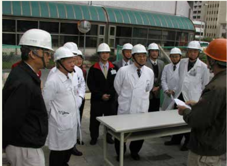
李院長(中)巡視醫學科技大樓工程。

李院長於92年5月接任北榮第7任院長，甫一上任就碰上舉國震驚的SARS風暴。李院長臨危受命配合國家防疫作為，將醫院長青樓改建為SARS專責負壓病房收容病患，於疫情期間共收治194位病患，是國內收治最多SARS病患的醫院，同時沒有發生任何院內感染事件，對我國SARS疫情控制貢獻卓著，榮獲行政院頒發有功醫療團隊獎。94年3月間復主持醫學科技大樓動土興建，至97年完工。至此北榮有了最先進的科技醫研環境，並邁向一個新里程。