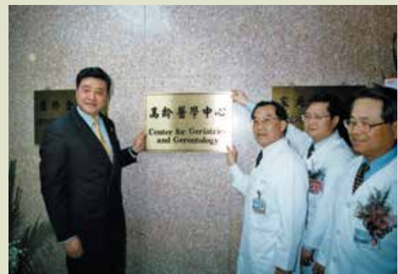
高前主任委員（左1）與李院長（右3）為高齡醫學中心掛牌。

民國95年2月16日成立「高齡醫學中心」，結合老人急性醫療、長期照護、預防保健、機構式照護、居家照護及輔助生活社區等6大項工作，並整合研究、教學、訓練及政策發展等方向，成立老化與抗老化研究組、環境安全與輔具設計組、醫療整合組、教育訓練組、長期照護與榮民照護政策研究組及高齡榮民生活品質提升等6大發展小組，為全國最完善的「高齡醫學中心」。