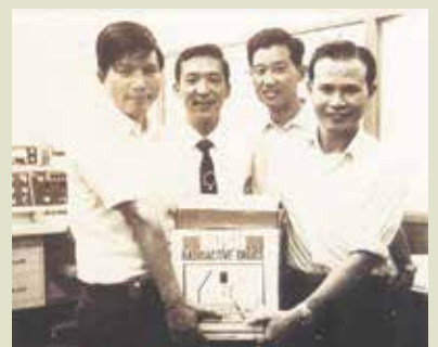
國內首批放射性同位素孳生器送抵本院核醫中心。