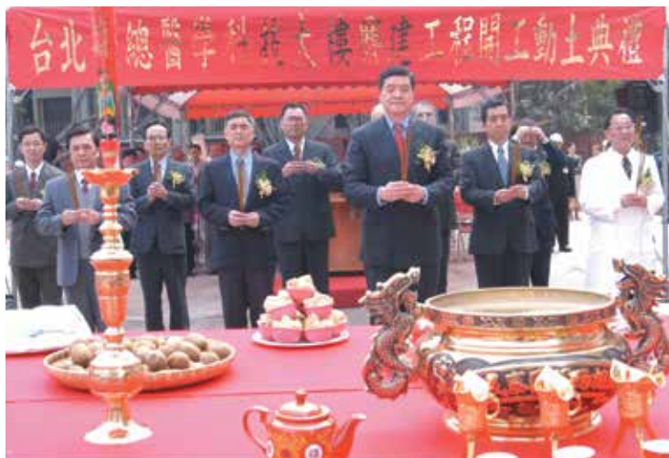
高前主任委員主持醫學科技大樓開工動土。

目前臺北榮總致力於神經修復及再生、人腦科學及認知功能研究、功能性腦神經造影、腦神經資訊、幹細胞研究、基因工程、生殖科技、臍帶血移植、生物影像整合、心電生理、電子病歷等尖端醫療科技的研發，提供民眾更好的醫療服務。而為因應科技時代的來臨，斥資21億餘元籌建1棟結合基礎、臨床、資訊科技與實驗動物中心的醫學科技大樓，93年12月開始動工，已於97年3月完工，現為國內最先進的醫學研究實驗室之一。