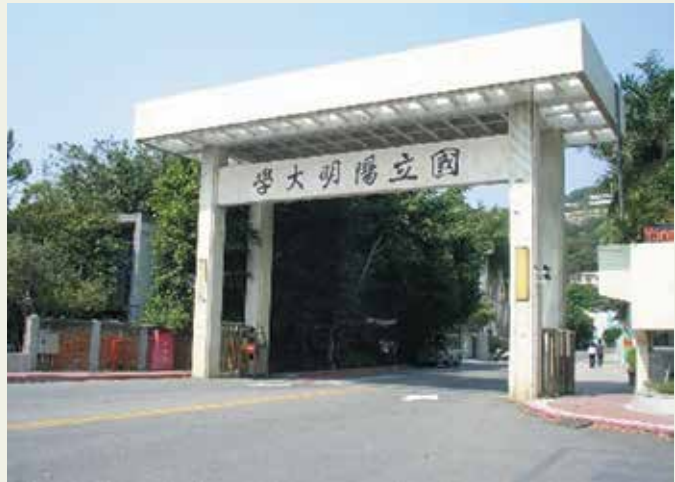
陽明大學校門一景。

本院於民國60年籌建國立陽明醫學院，由本院規劃及撥地興建的陽明醫學院於64年7月正式成立並移交教育部，現已改制為大學，培植無數專業醫事人員。