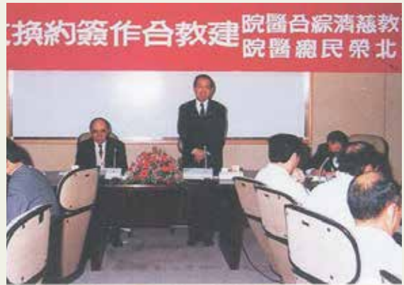
羅院長代表本院與慈濟醫院簽訂建教合作。

此外羅院長為建立榮總平民化的形象，推動榮總醫療服務擴及全臺，除臺中、高雄均設有榮總外，宜蘭、金門、澎湖等地區也納入北榮醫療服務的範圍，讓這些地區的居民也和都會地區居民一樣，能感受到醫學中心等級的服務，真正的實踐榮總創院之初的宗旨。