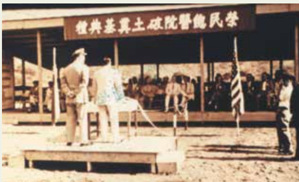
民國46年臺北榮總破土奠基。

本院成立於民國47年7月1日，48年3月開始門、急診作業，同年11月1日正式開幕。本院之創立原以服務榮民（眷）為主要宗旨，故定名為榮民總醫院。