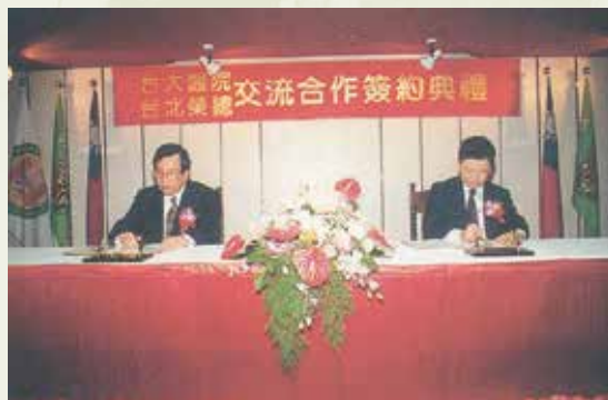
程院長（右）代表與臺大醫院簽訂交流合作。

除了全力充實醫院的軟硬體設備之外，程院長常勉勵同仁要「視病猶親」，希望改變一般人對醫生高高在上的刻板印象。他期盼榮總同仁都能秉持以「病患為第一」的原則，展現榮總醫護人員優良的服務精神。