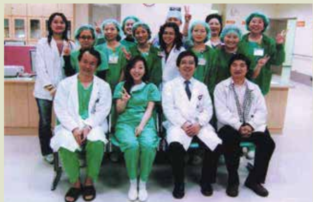
外科醫療團隊成員攝於新開刀房啓用日。

新開刀房之使用空間加大，採無塵地板，所有氣體供應均為中央控制。也設置家屬等待區，以符合「以民為主，以客為尊」的現代服務要求。