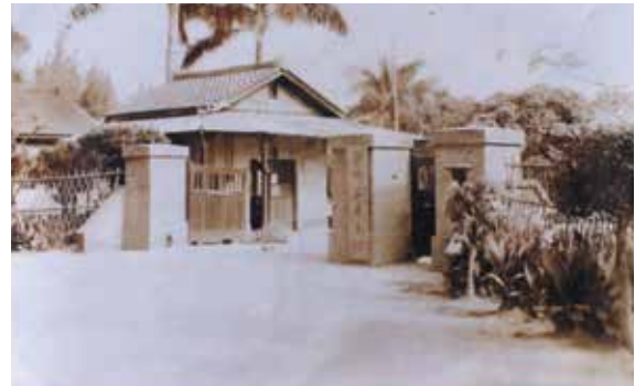
本院前身為陸軍慢性病醫院民國48年7月改隸輔導會。

本院成立於民國41年元旦，原為陸海空軍肺病療養院，44年改為陸軍第1肺病療養院。至48年7月，因社會環境的需要，改隸行政院國軍退除役官兵輔導委員會，並命名為嘉義榮民醫院，下設仙草、灣橋、鹿滿、田中四個分院。52年隨階段性任務陸續完成，仙草及田中分院相繼轉型為白河榮家及彰化榮家，55年灣橋分院亦隨之獨立為灣橋榮民醫院，並下轄鹿滿分院。本院復於63年3月由肺結核病醫院改為綜合性醫院，並附設民眾診療所，73年經行政院衛生署納入「全國醫療網計畫」，以原有院區更新改建，自79年至93年相繼完成醫療網第1至第3期擴建工程，為榮民（眷）及地方民眾提供現代化之醫療環境。