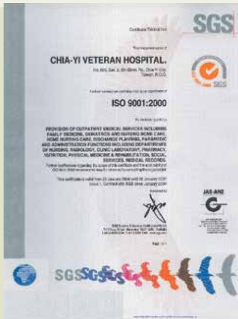
92年1月榮獲「老人照護ISO-9001」認證證書。