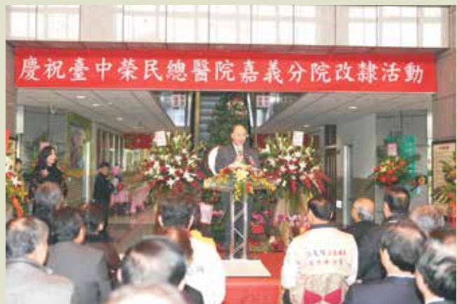
曾前主任委員主持改隸揭牌活動。

行政院推動組織再造，輔導榮民總醫院與各地區榮民醫院進行水平與垂直整合，嘉義榮民醫院於民國100年1月完成與臺中榮總垂直整合，改隸為「臺中榮民總醫院嘉義分院」，藉由整合醫療資源的型態，提供更多優秀的醫療團隊與儀器及資源，提升至醫學中心的醫療服務水準，讓雲嘉南地區的民眾享獲更多、更完善的醫療資源及更妥善的醫療照顧。