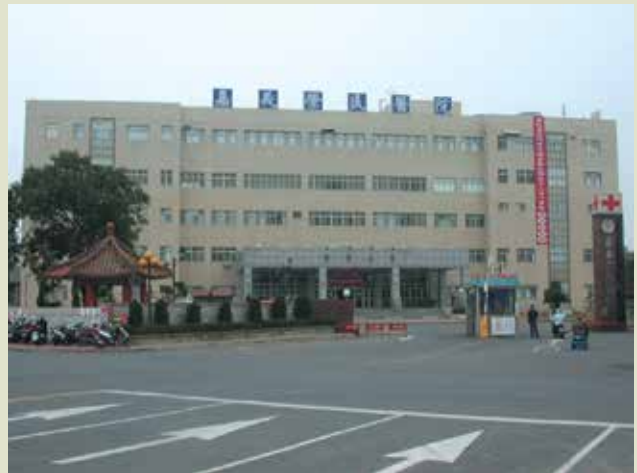
民國92年底完成之醫療綜合大樓（93年元月以世賢路二段600號做為正門出入口）。

A棟大樓面臨世賢路二段，視野廣闊，氣派雄偉，為五樓建築物。一樓大廳配置藥局、檢驗科、放射科及急診室，二樓為門診部，三樓為行政中心，五樓為現代化之開刀房，六樓為內外科加護病房。本大樓前方為醫院正門是車輛、人員主要進出口並設置車輛收費亭及柵欄取票機管理。