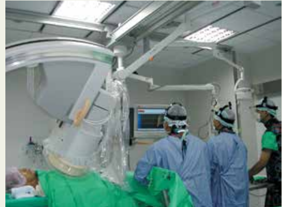
心導管臨床醫療作業情形。

最新的心導管設備，提供精密正確的治療。本院心導管室於民國91年8月5日成立，以ROT（整建、營運、轉移）外包方式辦理，共節省公帑約5千萬餘元。醫療團隊採24小時待命救援，為12所榮院之首創，至94年11月施作案例已超過1,000餘例。