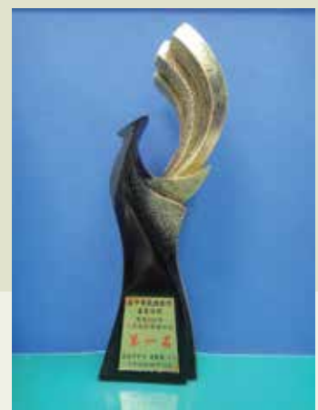
臺中榮民總醫院嘉義分院榮獲102年「二代戒菸服務評比」第1名。