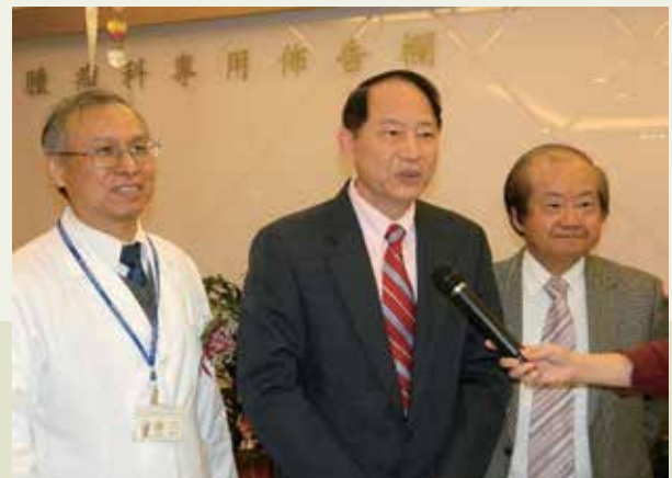
董主任委員出席加馬刀治療中心揭牌活動。

臺中榮總嘉義分院於102年12月12日由輔導會主任委員董翔龍、臺中榮總李三剛院長及嘉義分院鄭紹宇院長共同為雲嘉首座「加馬刀治療中心」揭牌啟用。