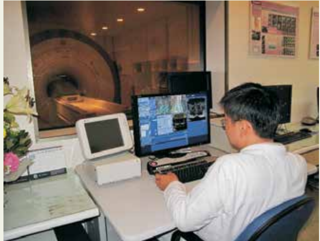
啓進先進磁振造影儀服務民衆。

本院為提升醫療品質，讓在地鄉親能享有優質先進的醫療照護，特別購置由美國奇異公司所生產之最新型而且功能最好的1.5T高階磁振造影儀，可以超快速提供人體三度空間全方位清晰的診斷影像，代表著嘉義榮民醫院影像診斷邁向更高的水準，97年12月30日退輔會高華柱主任委員、嘉義市黃敏惠市等人共同主持剪綵典禮啟用，讓民眾的健康獲得更大的保障。