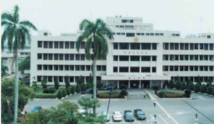
民國79年完成E棟大樓。

本院成立於民國41年元旦，原為陸海空軍肺病療養院，44年改為陸軍第1肺病療養院，73年經行政院衛生署納入「全國醫療網計畫」，以原有院區更新改建，為榮民（眷）及地方民眾提供現代化之醫療環境。