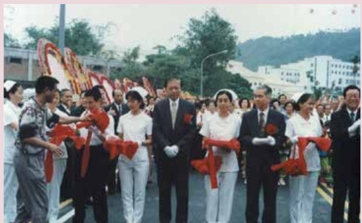
本院聯外道路通車典禮。

灣橋榮院原先為陸軍療養機構，地處嘉東偏遠鄉下，交通甚為不便，知名度不高，而嘉義地區由於工商業日漸發達，人口不斷增加，醫療需求亦成為民眾不可或缺的重要課題，本院地處山邊，進出均須經過羊腸小徑，不但造成看病民眾的不便，車輛進出亦甚感困難，直接與間接影響醫院的發展前途，因此，拓展連外道