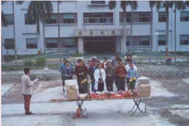
精神科病房落成啓用。

由於工商業的發達，經濟及社會型態的改變，各方面的壓力接踵而來，首當其衝的是人民精神打擊無法承受，造成諸多家庭與社會問題，精神病亦隨著社會文明應運而生。雲嘉地區地處偏遠，醫療資源貧乏，每遇精神病患均須遠程跋涉，造成人力、物力的浪費與不便。灣橋榮院有鑑於此，遂在民國年月開設精神科病房，為雲嘉地區規模最大的精神病照護醫院，為雲