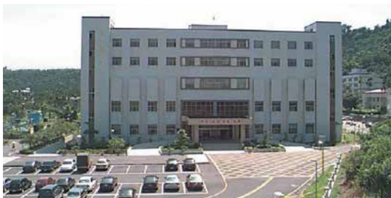
灣橋榮院醫療大樓。