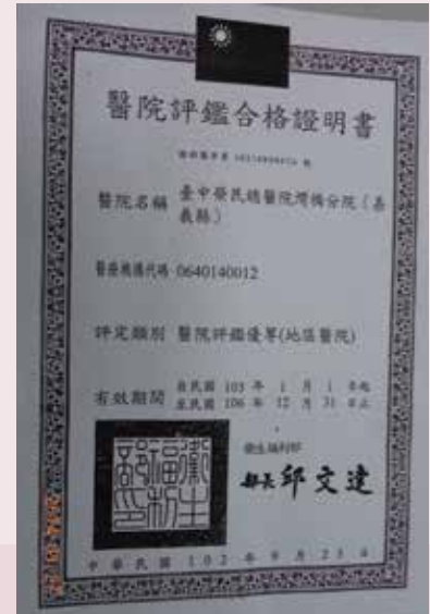
臺中榮民總醫院灣橋分院獲醫策會102年度新制醫院評鑑，評定為「優等」。