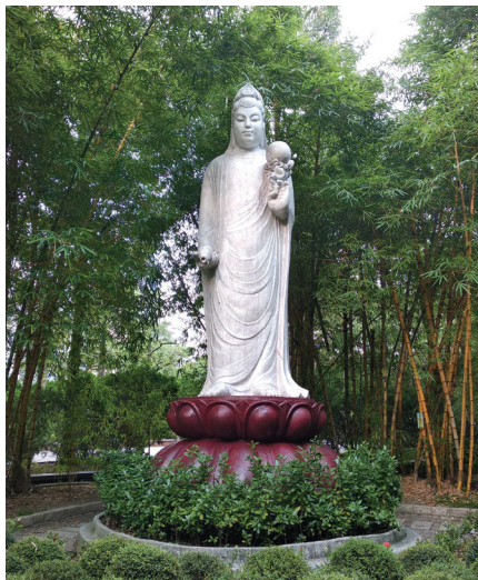
臺北市大安森林公園的觀音大士聖像，手托淨瓶，慈祥寧靜。

我們的《榮光雙周刊》為我彙集的第一本《大鵬隨筆》裡，我在自序文中特別表明，「我深切瞭解」《榮光雙周刊》是「國家的公器」，不可營私結黨、不涉政治、不揚私怨、以直言無畏的風格下筆。