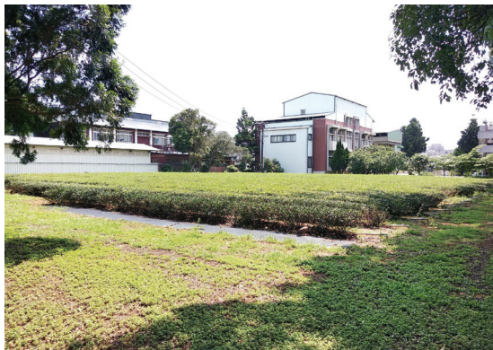
五守新村鄰近農委會茶葉改良場，主委的父親曾在這一帶教人打太極拳。

在家裡坐著，過了隔壁的圍牆，才能看到在外面搭著葡萄架的家，一過圍牆怎麼見到老爸站在葡萄架下，嚇了我一跳！他怎麼可能一個人走出來呢？