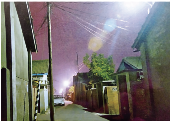
主委早年居住的五守新村，紅磚、黑瓦、長巷，充滿眷村風情。

我老爸是在家看到她，我是進兩邊都是圍牆的窄巷子，讓她先過，也順勢看了她一眼，她的長相姣好，個頭約有一七〇公分，心想怎麼這麼熱的天，還頭戴白紗、穿著白長袍？我大嫂是在眷村前二排，參加做手工藝品貼補家用，每個小時休息時就趕回家看看老爸（我的母親住在臺北二姊家），就在她要出巷口時，那白長袍女子剛好進巷口，與對方打了個照面。