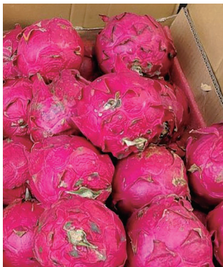
紅肉火龍果的甜美可口，令主委印象深刻。

我又看到最愛的紅肉火龍果了，因為民國八十二年我由美國卸任武官後，回到之前當政戰部主任的臺東志航基地當副聯隊長，老同事們讓我品嚐了我未曾見過的紅肉火龍果，我把一盤幾乎吃光，晚上去洗手間出來時驚慌地告訴他們，我好像有「血尿」的現象！他們笑著告訴我：「這是正常現象啦！」沒想到鬧了一個令人難忘的笑話。 這次又發現了綠色的及和愛文一樣紅色的大芒果，真想買來嘗嘗，我告訴自己不要衝動，用手機拍下來畫餅充飢吧！但此時卻想起如果孩子有多好，可以買給他們享用啊！他們因為疫情，已有二年沒有回來看望我們了，一時內心不禁有些惆悵。我們鼓勵孩子們出國進修，結果他們自然地在當地生了根，也有了孩子，現在我們兩老卻像枝枯藤，盼望著何時會有喜鵲來停