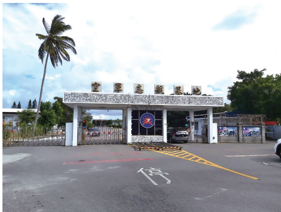
主任委員曾在圖中的空軍志航基地擔任政戰部主任，後升任副聯隊長。

「這麼大怎麼吃？」我開玩笑地說：「用嘴巴吃啊！」那位擔任翻譯的小姐，笑得幾乎搗不住嘴。我問她笑什麼？她說：「我們日本人不會這麼幽默。」第二天開會前，我問那位首長：「芒果吃了嗎？」他說：「帶回家時香味撲鼻，我和內人都捨不得吃，就先去供祖先了。」當時是二個就能裝滿一個禮盒，這件事曾讓我難過地責怪自己，當時為什麼不多送他一盒。