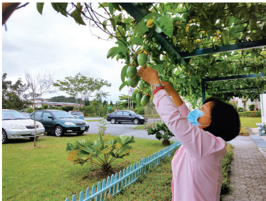
花蓮榮家種植的百香果，風味甚佳，吸引住民摘果品嘗。

我又看到最愛的紅肉火龍果了，因為民國八十二年我由美國卸任武官後，回到之前當政戰部主任的臺東志航基地當副聯隊長，老同事們讓我品嚐了我未曾見過的紅肉火龍果，我把一盤幾乎吃光，晚上去洗手間出來時驚慌地告訴他們，我好像有「血尿」的現象！他們笑著告訴我：「這是正常現象啦！」沒想到鬧了一個令人難忘的笑話。 這次又發現了綠色的及和愛文一樣紅色的大芒果，真想買來嘗嘗，我告訴自己不要衝動，用手機拍下來畫餅充飢吧！但此時卻想起如果孩子有多好，可以買給他們享用啊！他們因為疫情，已有二年沒有回來看望我們了，一時內心不禁有些惆悵。我們鼓勵孩子們出國進修，結果他們自然地在當地生了根，也有了孩子，現在我們兩老卻像枝枯藤，盼望著何時會有喜鵲來停