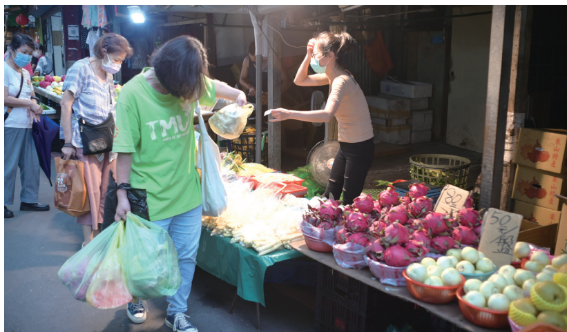
黃昏市場的菜販，拖著疲憊身軀急著叫賣攤位上的果菜，想早點賣完回家休息。