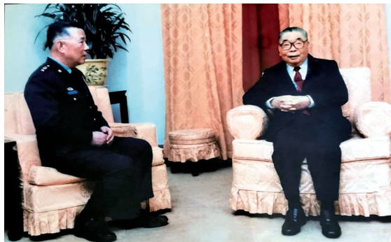
蔣故總統經國先生在許歷農將軍擔任總政治作戰部主任（左）及後來擔任輔導會主委時，都經常召見賦予任務。

「從戰爭到和平」的許歷農先生傳，由與他相識多年，且替「老爹」已編、著過二本書的名律師紀欣博士執筆，特選於七月七日對日抗戰紀念日，在「遠見天下文化出版公司」舉行新書發表會，因「許老爹」曾是退輔會主委，我沾了擔任現任主委之光受邀，但因當日出席行政院會，而未能如願參加。還好我們李文忠副主委亦受邀，正好代我出席。