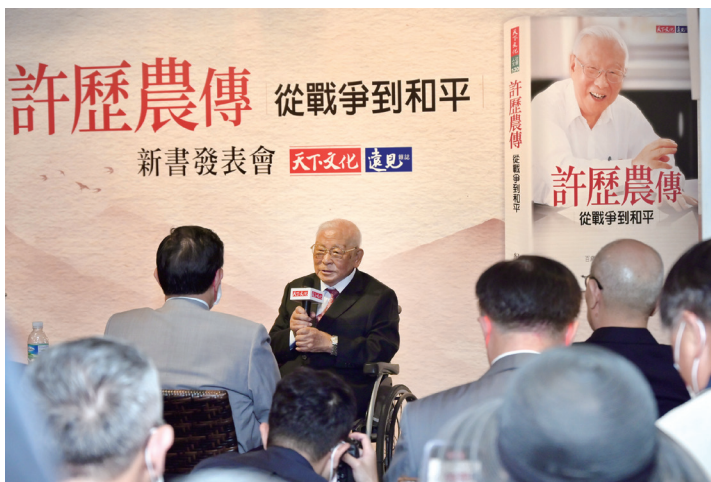
許前主委於新書發表會中，分享一生的回憶及和平的可貴。

接掌退輔會即將屆滿三年，大鵬主委在閱讀《許歷農傳》後感觸良深。主要是經國先生當年叮囑：「我們既然將老兵帶出來，就必須照顧他們」，「許老爹」盡心盡力，沒有辜負經國先生託付；而做為後繼，大鵬主委訂定「站起來，走出去」及「榮家應家庭化、社會化、智能化」的目標，更努力地向前邁進，更是點滴在心頭。