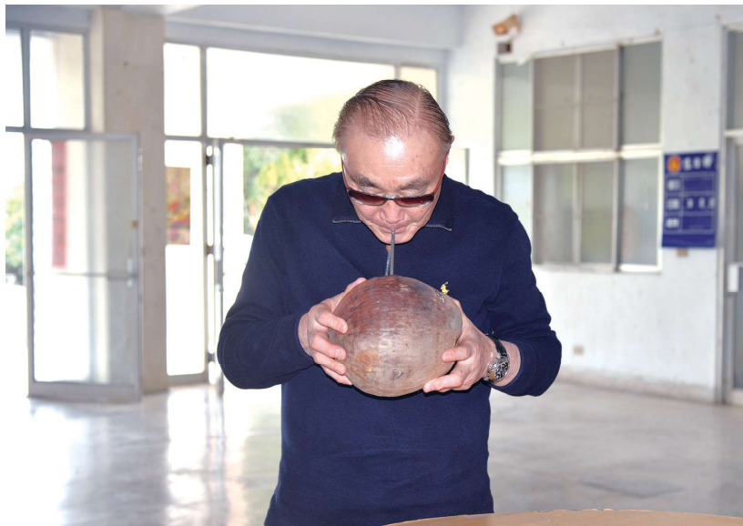
主委視導前會屬龍崎工廠用地時，曾撿拾椰子樹的落果，品嚐椰汁。

主任委員看到網路上的西瓜訊息，想起在盛夏中，品嚐臺灣盛產的大西瓜時，那又脆又甜的感覺，讓人心中心中充滿幸福。他又憶起童年時常吃到的土芒果和紅心芭樂，土芒果個頭不大，甜而不膩，帶著令人回味無窮的特殊芒果香味；紅心芭樂淡淡的紅色果肉，讓人看了就喜歡，也比較甜。主委由此對臺灣農業另有一番期許。