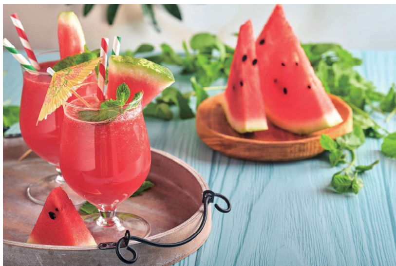
盛夏時，將西瓜切盤，或榨成果汁品嘗，都是解渴消暑聖品。 (圖／本刊編輯部)

網傳在中國大陸河北省館陶縣，一個種植火龍果農場的小鎮，培育出了深紅瓢、紫瓢、白瓢及綠瓢的西瓜，這實在令我驚奇，