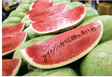
臺灣大西瓜為人間美味，老少咸宜。