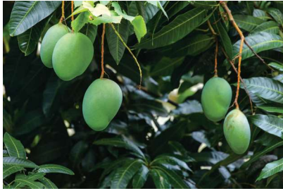
樹上未成熟的青芒果，吃在嘴裡被形容酸到牙齒都會掉下來。獨有的味道，令人難忘。（圖／本刊編輯部）