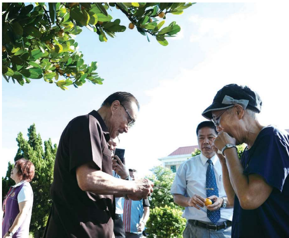
主委（左）在馬蘭榮家福樹下，介紹潘女士（右）吃福果。

我好奇地去查證我們所稱的「福樹」，得知它又稱「福木」或「金錢樹」，果實叫「福果」，