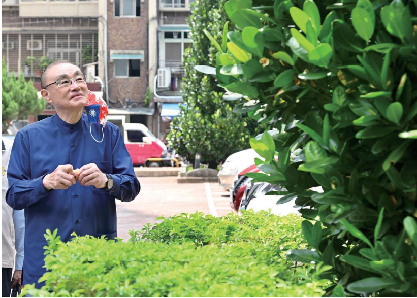
主委在輔導會旁欣賞福木及剝開福果，準備享用。