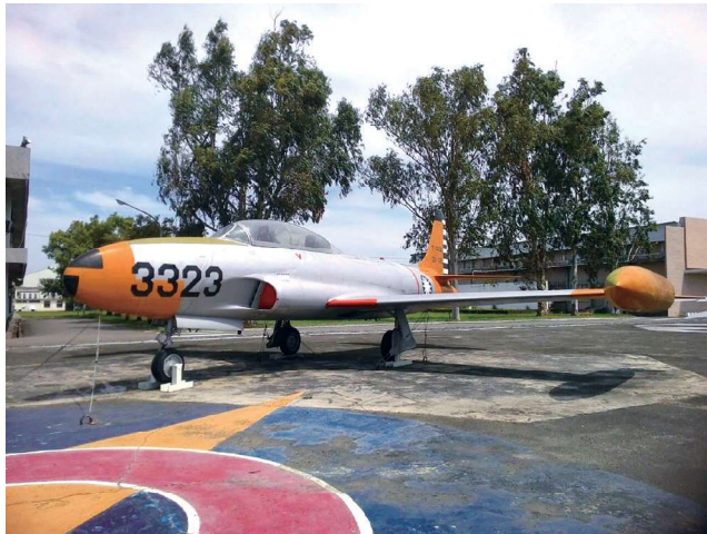
主委在學校飛 T-33 教練機（見圖）時，奠定了紮實的夜間起降能力。