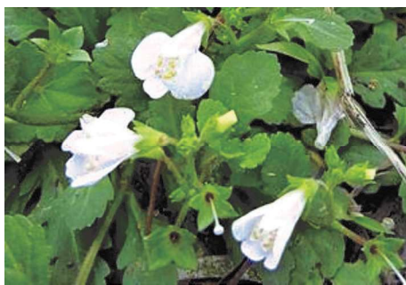
普通草地也能長出美麗的通泉草花朵，予人沉潛奮發的啟示。

了接送教官、同學們去飛行的「駕駛兵」，和隊上的勤務兵，現在想起來，都覺得不平與說不出地難過！