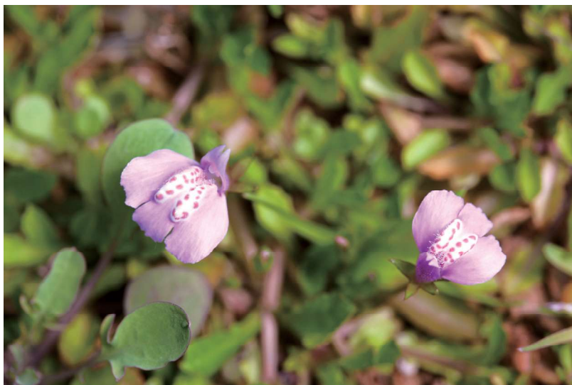
通泉草是生長在水邊草地的小野花，分布於亞洲各國。（圖／本刊編輯部）

「通泉草」在主任委員的飛行生涯中扮演著特殊的角色。主委在二十四歲時冤枉經歷了飛行挫折，失去飛行資格五年，當時他心情低落，卻意外發現在沒人關注的草地上，生長著美麗的通泉草小花，此一啟示，教導主委接受逆境，勇敢面對挑戰，並且重新燃起了對未來的希望。通泉草成為主委的幸運草，主委由此開創了璀璨的未來。