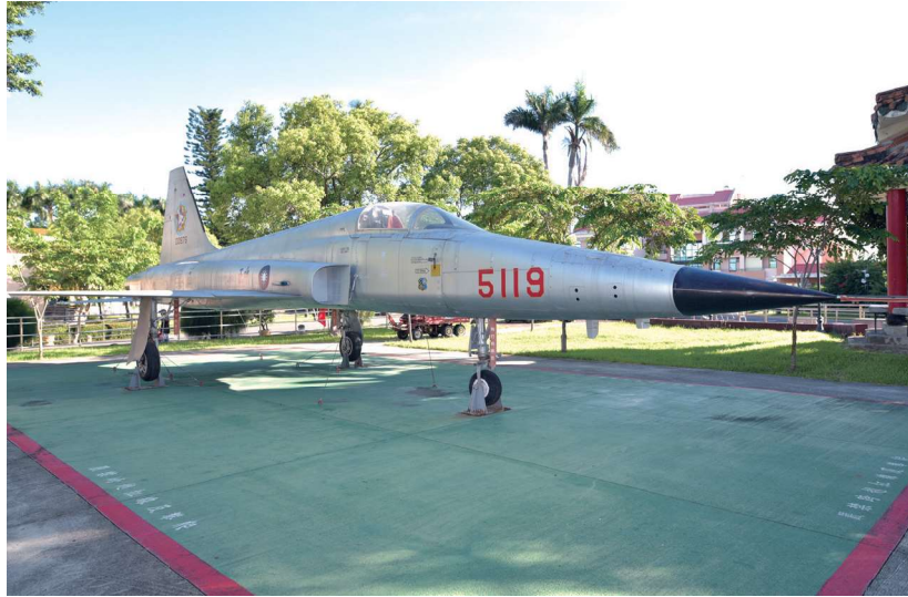
民國 50 年代，F-5E 戰機（見圖）已投入空軍服役。

我們九個同學，在民國五十八年六月三日完成部訓（戰訓），興高彩烈地分發到桃園五聯隊的五大隊，這是個有「老虎榮譽旗」的戰術戰鬥機部隊，令我們深感榮幸，我當時被分到第二十六中隊。