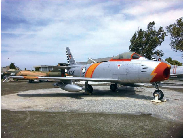
主委擔任飛行員之初，駕駛 F-86 戰機（見圖）出任務。

不意一日進行例行的夜航訓練時，那本是我的強項，從在學校高級組 T-33 教練機的夜航訓練，我就奠定了不錯的夜間起降能力。那天我是四架夜航訓練中的四號機，起飛、航行、返