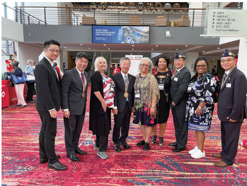
簡主任秘書（左四）於美國退伍軍團協會年會致詞後，與婦女會成員合影。