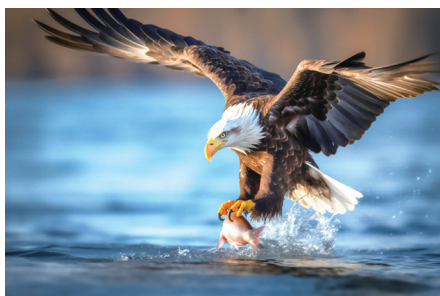
白頭鵬衝入海中捕魚，再波浪而起。

門大廳的牆面裱掛起來，讓同仁、訪賓共賞。讓崔奧拉總會長的祝福永續：「期盼同為民主自由陣營的中華民國，持續自由翱翔於天際。」更要讓這個信念，鑲嵌在每個人的心裡。