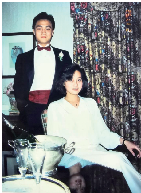
主委的兒子和女兒優雅合影。

記得有一年我去美國出差，順道到女兒家，看到他們的溫室種植許多植物，我趁他們去上班時，把這些花草加以修剪，她回來看到了，抱著我說：「謝謝你，老爸，但以後我想你時怎麼辦呢？」我說：「丫頭，就把那些花澆澆水吧！」