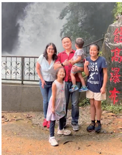
主委的兒子偕妻、子遊覽能高瀑布。