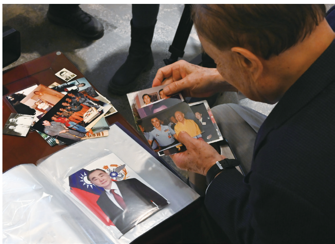
翻閱昔年照片，主委走進自己的時光隧道。（圖／林建榮）

主任委員打開一包封存已久的相片，眼前浮現他從小學、初中、空軍幼校、空軍官校，到飛行學校的點滴，待翻到升上校、上將的照片，更勾起無數回憶。從活潑頑皮的孩童到如今人們眼前光鮮的主委，一路走來，充滿了磨練與感激。主委將這段寶貴的時光隧道與大家分享，讓大家一起回顧他成長的足跡，感受合作與成長帶來的溫暖與力量。