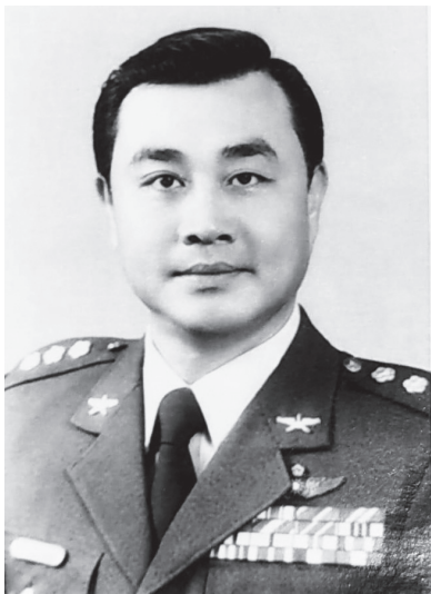
民國 76 年，主委時任桃園 401 聯隊第五飛行大隊上校大隊長。