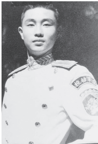
民國 50 年，主委就讀空軍幼校時，參加國慶閱兵大典，並被選為模特兒。