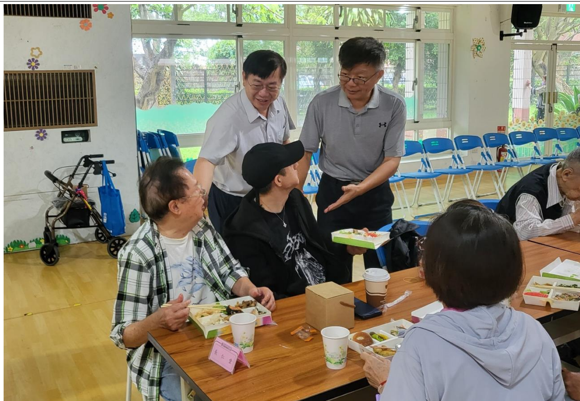
附件一：113年端午節家屬懇親座談會