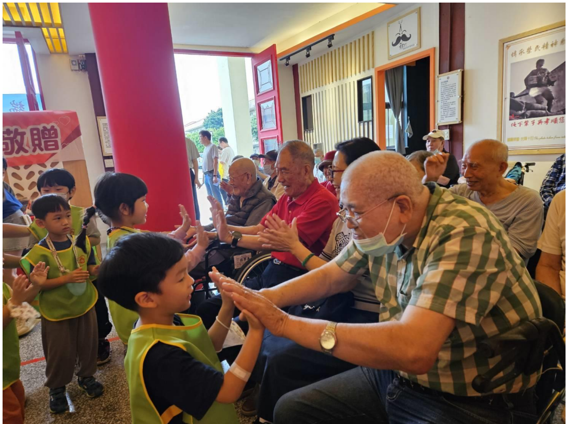
附件二：仲夏闖關樂端午(老幼闖關活動)