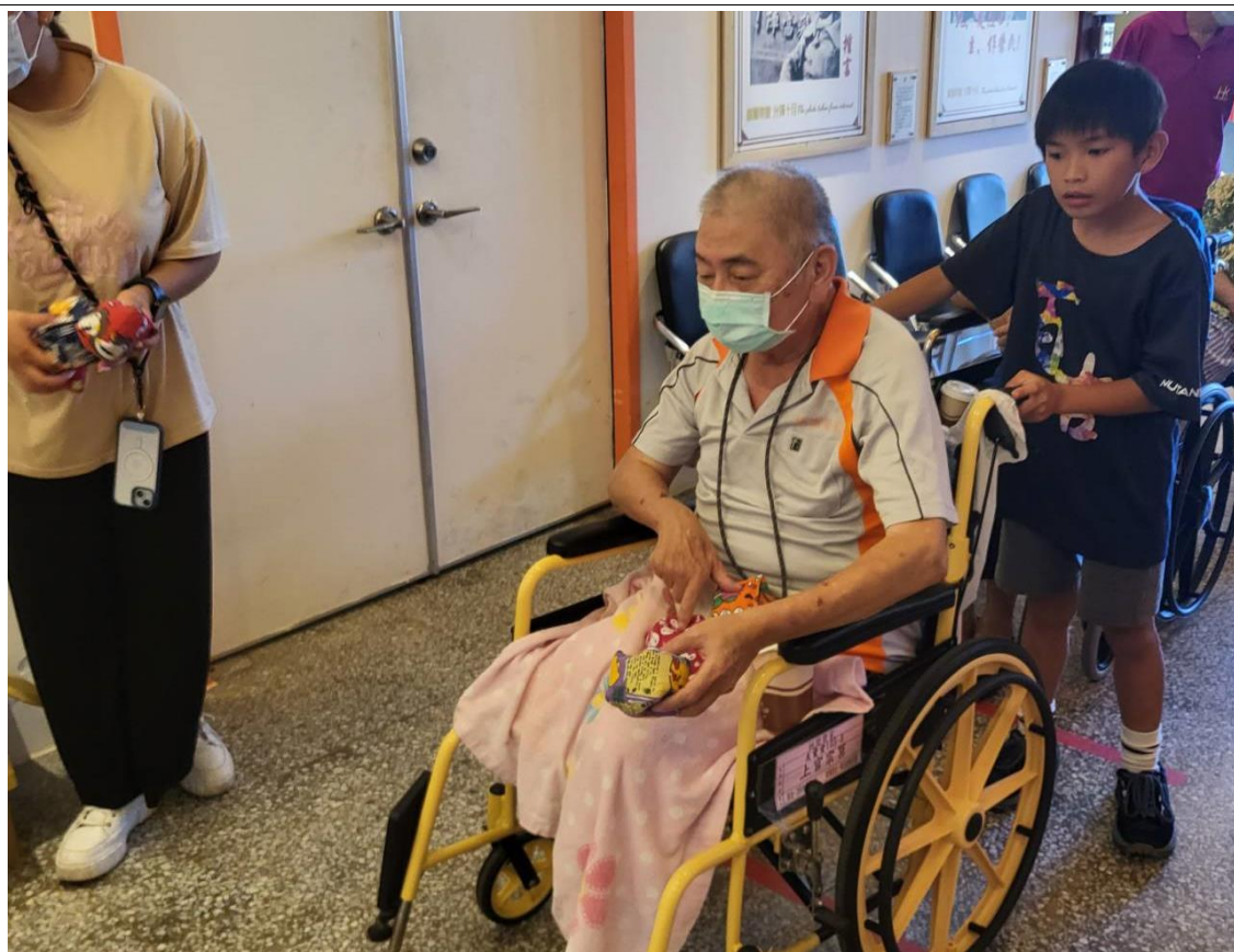
附件四：百吉國小傳愛藝起來