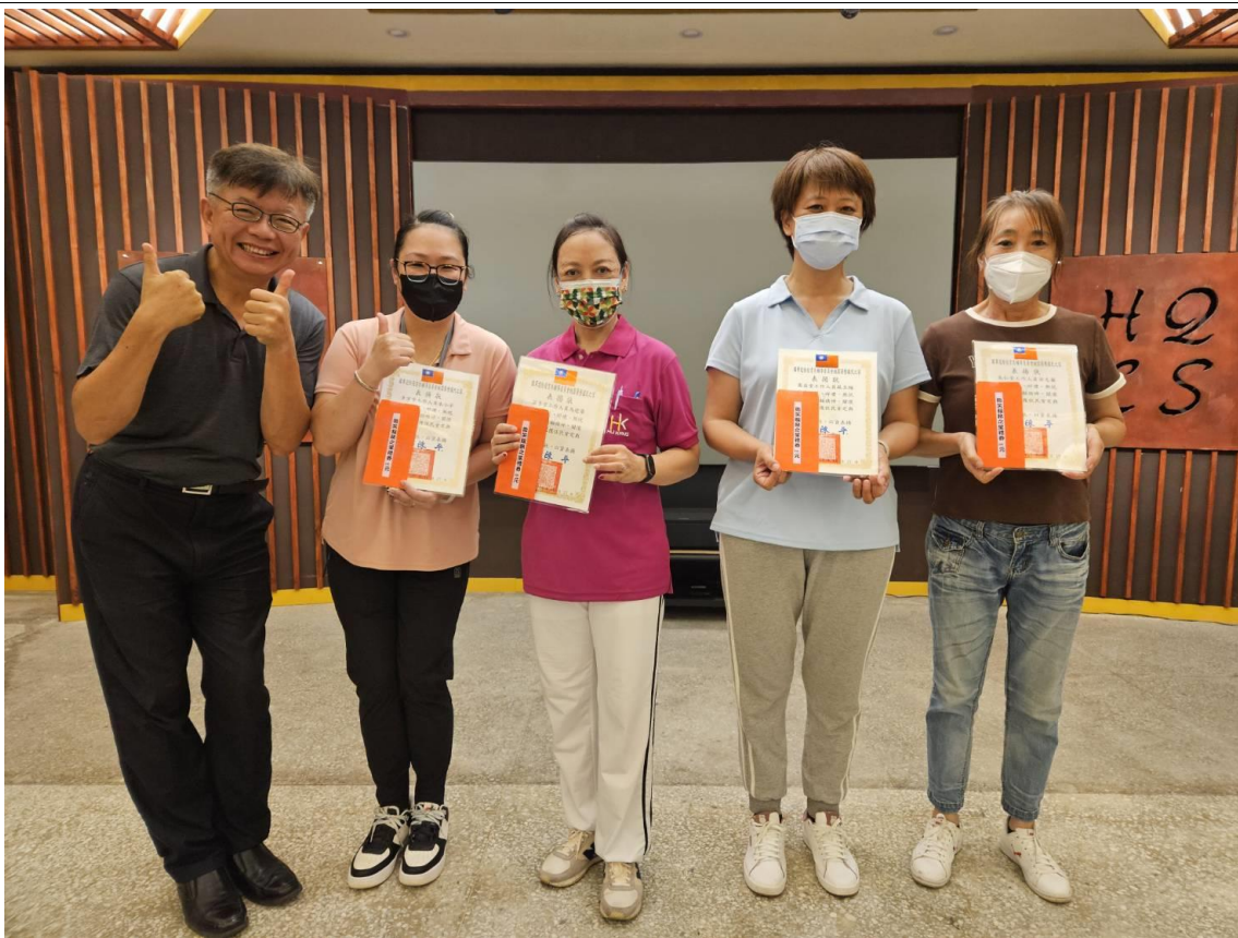
附件五：6月份住民壽星慶生會