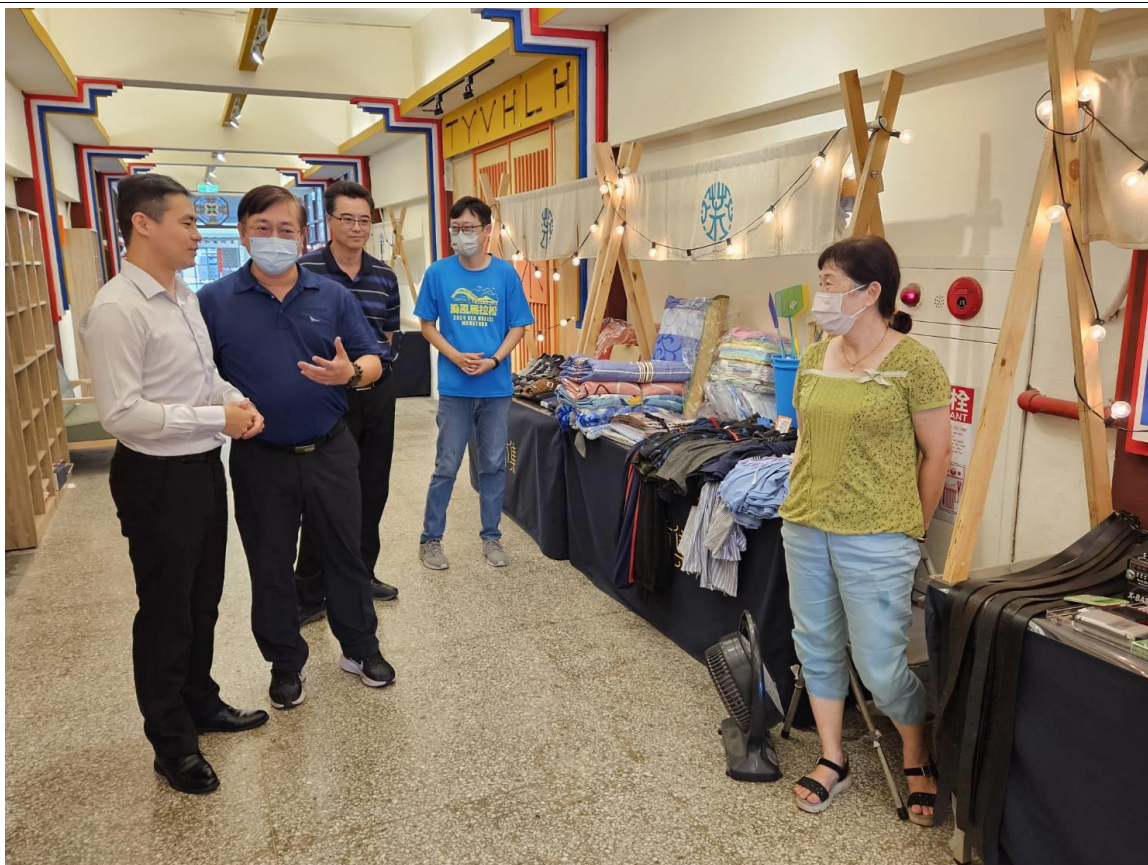
附件三：德高實業股份有限公司捐贈抑菌凝膠儀式