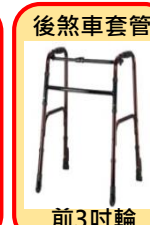
後煞車套管 前3吋輪