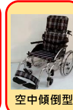
鋁合金 高背特製輪椅