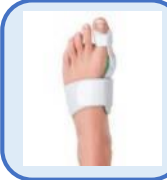
拇趾外翻 夜間支架