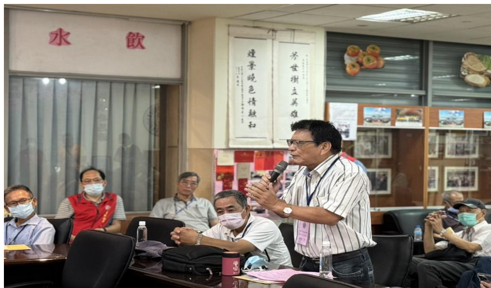
相片主題(2)：與會退除官兵代表發言提供建議事項。