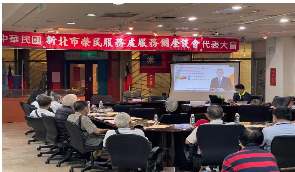
相片主題(4)：金融教育課程宣導：「消費者的基本保障－認識強制險、微型保險與小額終老保險」。