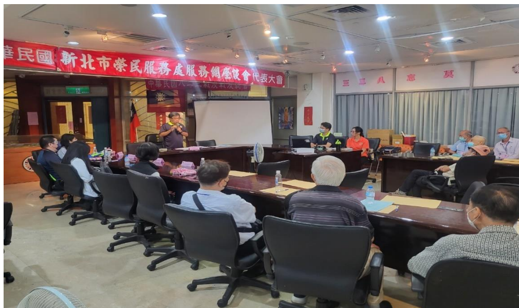
相片主題(1)：副處長主持服務區座談會暨答覆與會退除官兵代表相關建議事項。