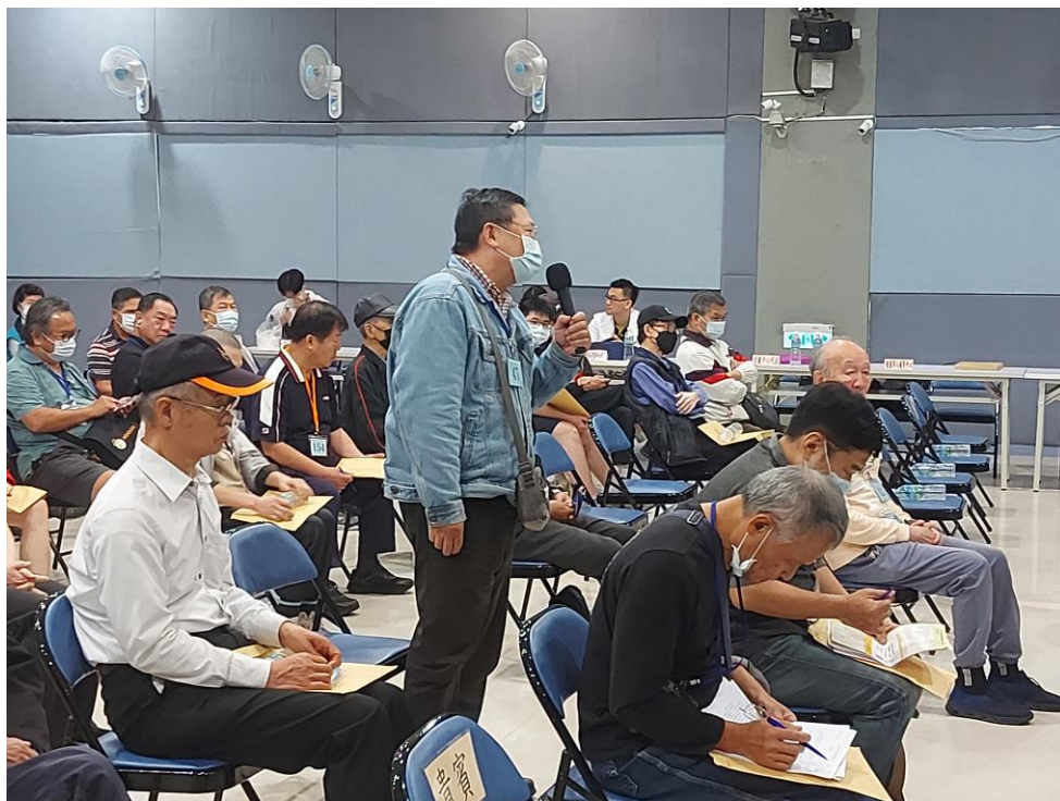
相片主題(16)：與會榮民代表發言踴躍提供建言 1