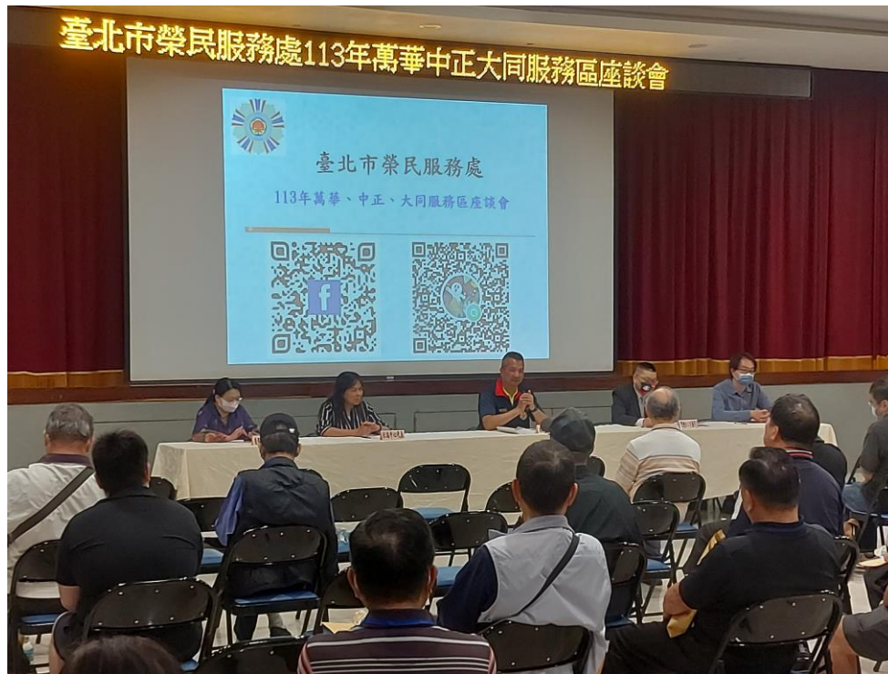
相片主題(15)：座談會與榮民代表面對面溝通、傾聽心聲