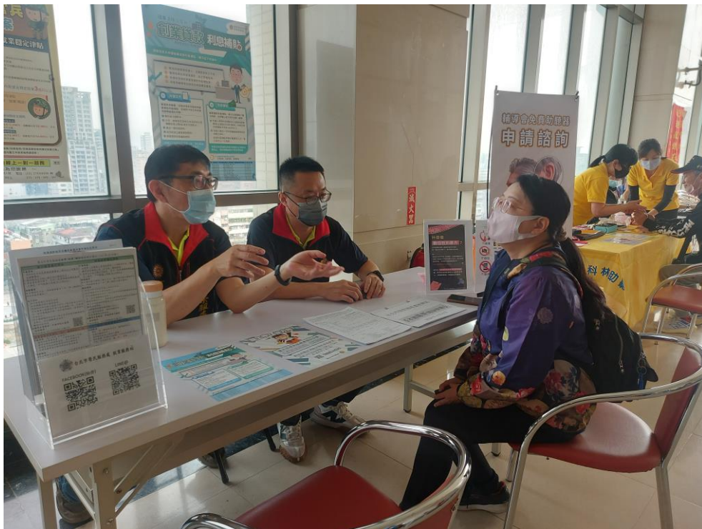
相片主題(12)：就學、就業暨職訓服務站