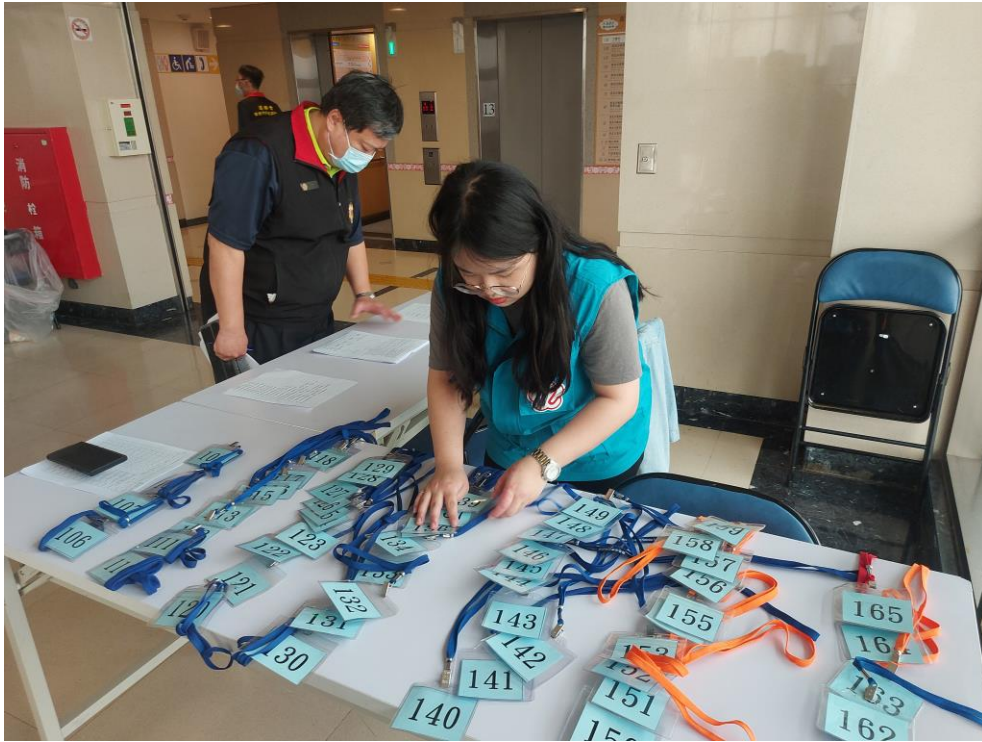
相片主題(11)：榮欣志工會場服務，協助報到準備及引導