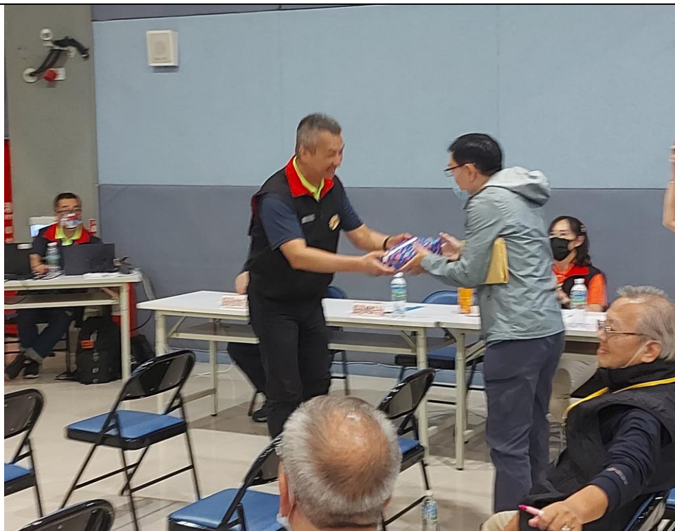
相片主題(10)：會中有獎問答活動由處長致贈禮品氣氛熱絡