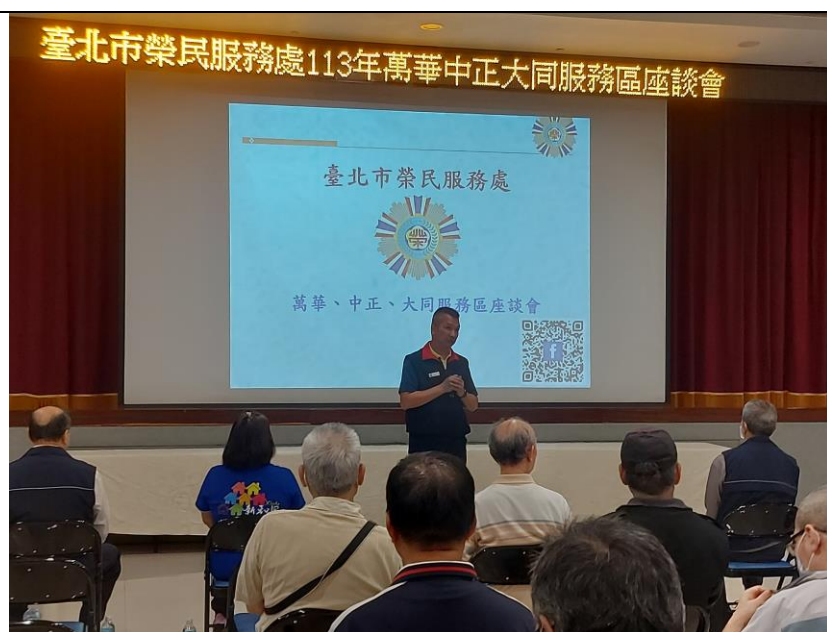
相片主題(2)：處長主持退除役官兵代表服務區座談會