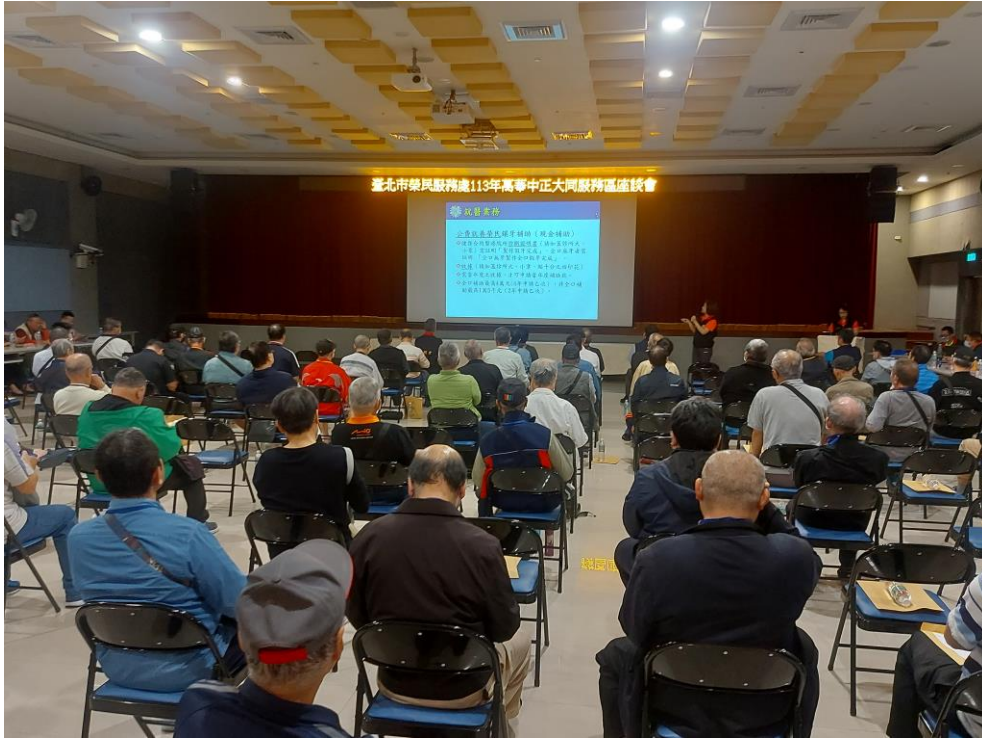
相片主題(5)：本處六大核心業務服務工作宣導情形 1