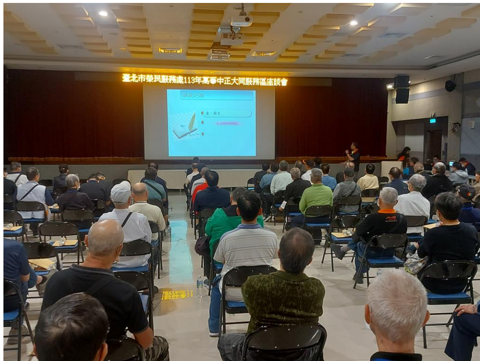
相片主題(6)：本處六大核心業務服務工作宣導情形 2