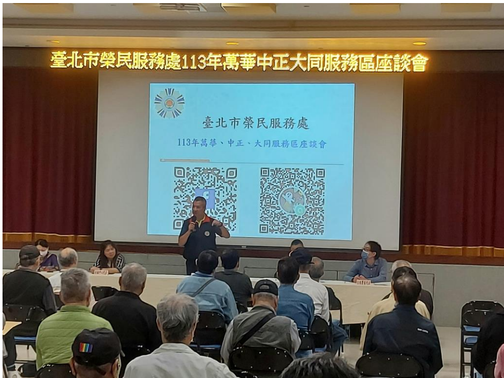
相片主題(18)：處長對榮民相關提問親自答覆與說明