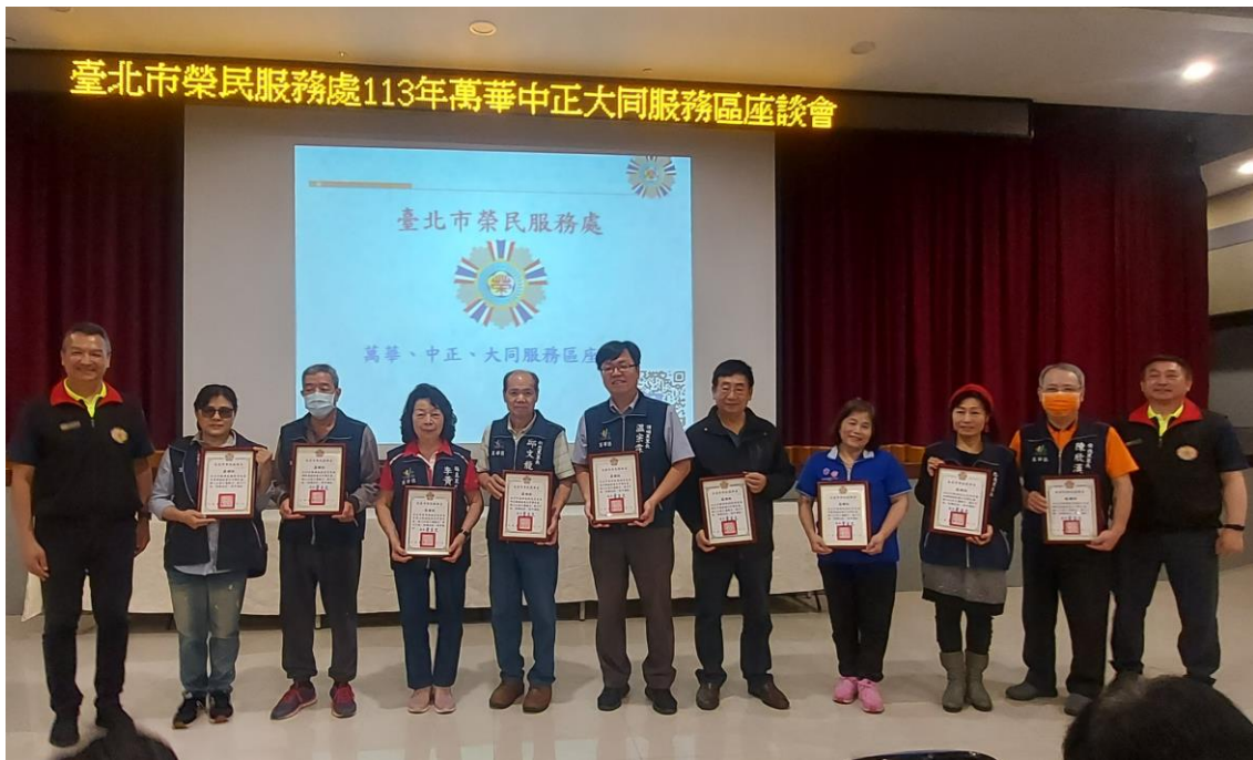
相片主題(3)：處長對轄區里長長期協助榮民服務表達謝意 1