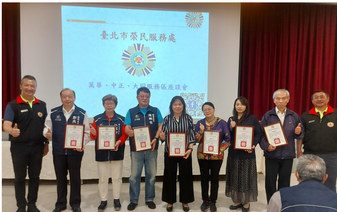
相片主題(4)：處長對轄區里長長期協助榮民服務表達謝意 2