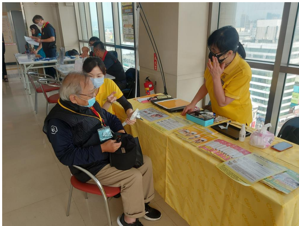
相片主題(14)：助聽器服務站