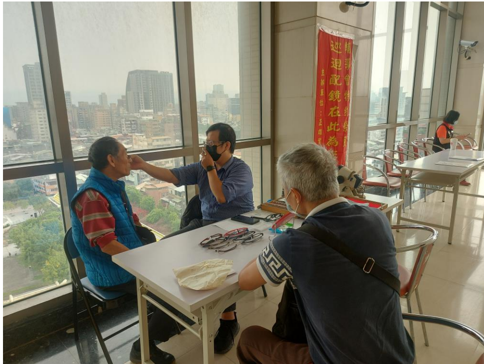
相片主題(13)：配鏡服務站