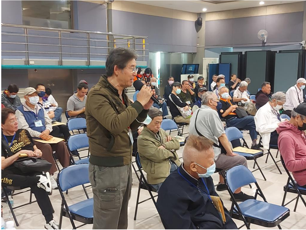
相片主題(17)：與會榮民代表發言踴躍提供建言 2