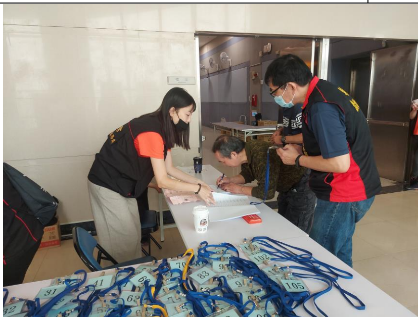
相片主題(1)：與會榮民報到參加服務區座談會