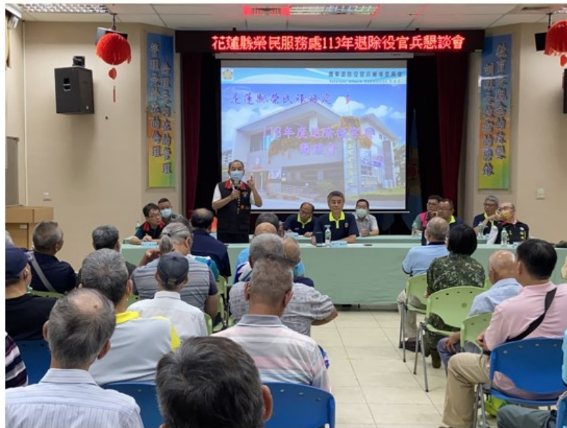
相片主題(3)：花蓮縣政府北區服務中心張治華副主任發言