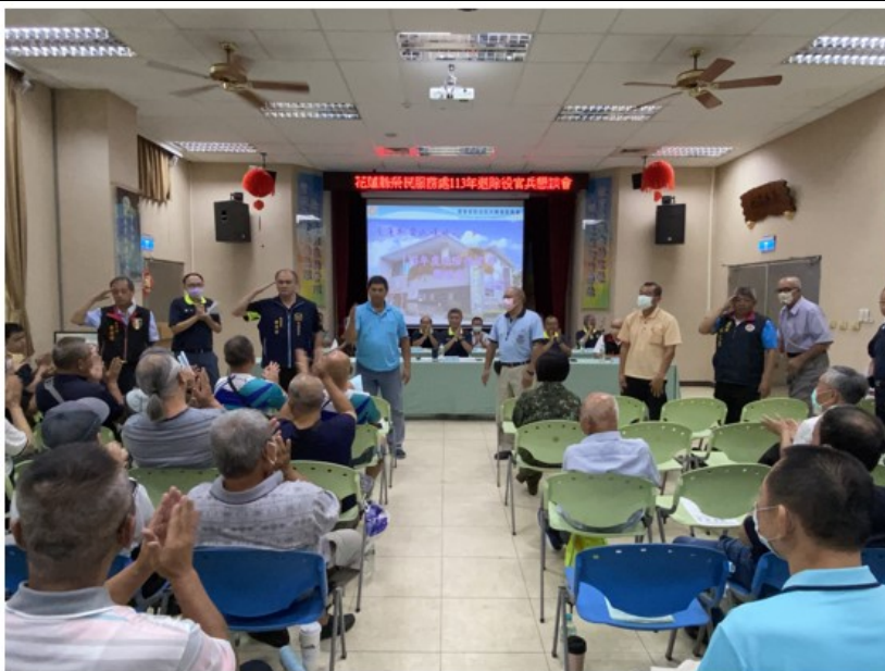
相片主題(4)：各退伍軍人社團代表踴躍出席與會