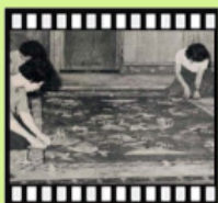
民國54年榮民製毯廠 榮眷製作地毯