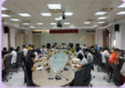
四技大學甄試入學招生委員會