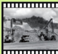
民國56年曾文水庫興建