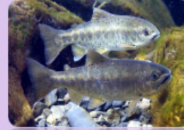
武漢農場保育臺灣國寶-櫻花鉤吻鮭