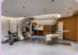
臺北榮總重粒子癌症治療中心