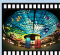
民國97年高雄捷運-光之穹頂

配合政府行政革新政策，逐年調整組織功能，將業務性質相近、不符時代需求之所屬機構分別簡併裁撤或轉民營。由於當年來臺退伍榮民前輩們（民國 100 年約 45 萬人）已邁入高齡，除擴建醫療、安養設施外，整合資源，並完成由基層醫療（榮家保健組）、地區榮民醫院（分院）及各榮民總醫院所構成完整三級照護體系，成為全民醫療體系重要之一環。至民國 102 年配合行政院推動組織改造調整組織架構、並承接國防部退除給付發放工作。