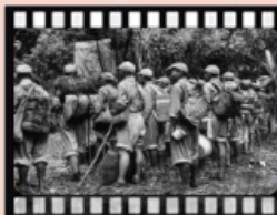
民國38年剿共-滇緬戰役