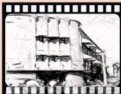
輔導會成立會址位於臺北市館前路54號大樓(現為國立臺灣博物館古生物館)

軍人犧牲一生中的精華歲月保家衛國，退伍後成為榮民，輔導工作是落實政府對功勳人員的照顧，不僅是義務，更是政府的道義與責任，另一方面是有計畫地給予輔導（民國43年安置約2.5萬人），使其退伍之後，能在其他工作崗位上，繼續報效國家。