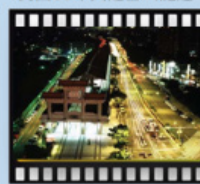
民國91年臺北捷運淡水水線