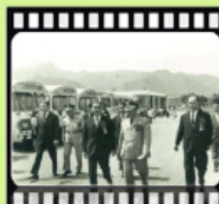
民國58年欣欣客運開幕