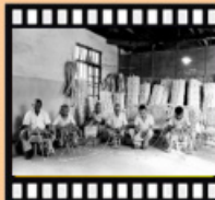
民國50年臺南榮家榮民製作藤編

早年榮民前輩們多為青壯年、未領退休俸且無謀生技能，生活十分清苦，除設置各安養及醫療機構照顧老弱身障疾患榮民外，並輔導有工作能力者參與農墾及興建國家公共工程建設，如清境農場、武陵農場、福壽山農場、中橫公路、北橫公路、中北部與東部產業道路及林道，榮民前輩在資源艱困下，憑藉人力及簡陋工具，筚路藍縷中奠定民生經濟發展基礎（民國45年安置約6.8萬人）。