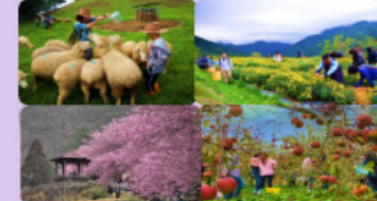
清境、武陵及福壽山農場環境教育、生態旅遊

秉持傳承榮民精神、悉心照顧退除役官兵，民國 104 年擴大將曾參與保衛國家重要戰役者納入服務對象；因應募兵制推動，民國 105 年服務照顧對象擴大至第二類退除役官兵（服役 4-9 年），截至民國 112 年約 31 萬人。運用科技，建立榮民三級醫療長照網絡；所屬農場以生態保育、環境永續方式發展綠色旅遊，提供民眾優質之休憩處所。