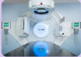
高雄榮總高劑量率全方位加速器