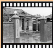
民國47年臺北榮服處(臺北市榮服處前身)