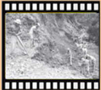
民國49年興建全省產業道路及林道