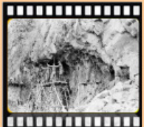
民國45年興建中橫公路