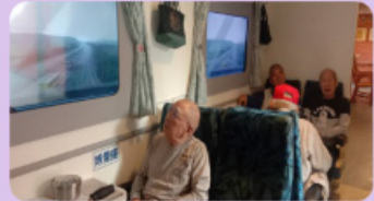
失智照顧專區-體驗4D懷舊火車