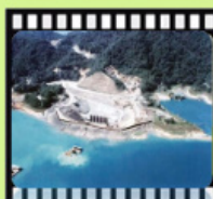
民國68年南投日月潭明 湖水電廠竣工