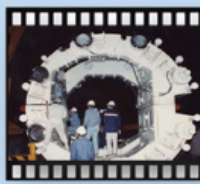
民國80年興建雪山隧道