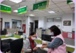
榮民服務處單一服務窗口