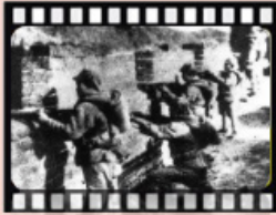
民國30年抗日-古北口戰役