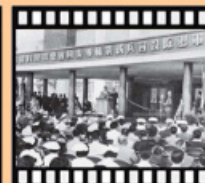
民國48年臺北榮總開幕典禮