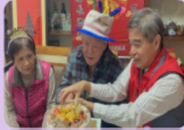
新北市榮服處慶賀榮民翁翁百歲壽誕