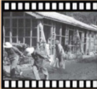
民國50年開墾清境農場