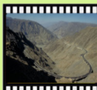
民國72年沙烏地阿拉伯 夏爾山區降坡道路