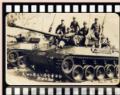
民國47年保臺-八二三砲戰