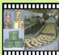
民國61年榮民食品工廠 (左為生產罐頭等產品)