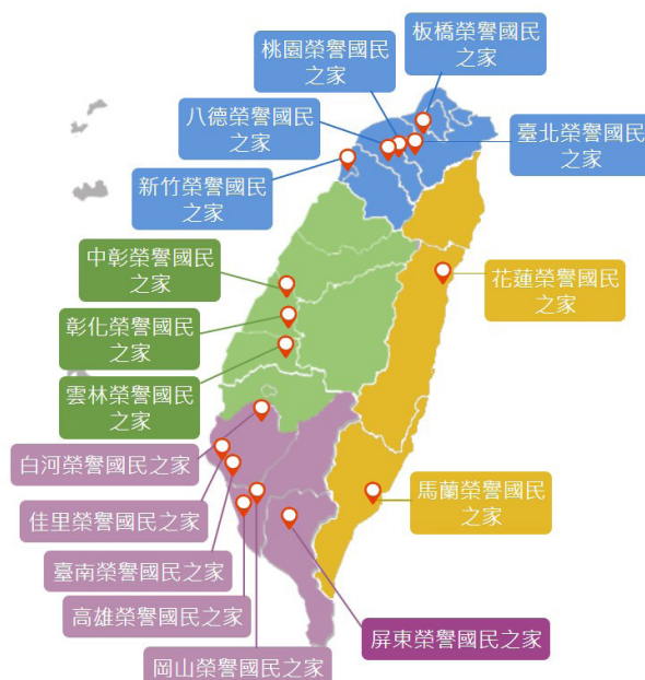
圖 3 安養機構分佈圖

為照顧榮民，編列榮民安養及養護費用：包含各榮家基本行政工作維持費、就養榮民給與、養護材料、文康活動及住院年節慰問等費用。分別於民國 109、110、111、112 年編列預算 77 億 7,344 萬 2 千元、74 億 7,881 萬 4 千元、75 億 811 萬 7 千元、73 億 4,232 萬 1 千元。