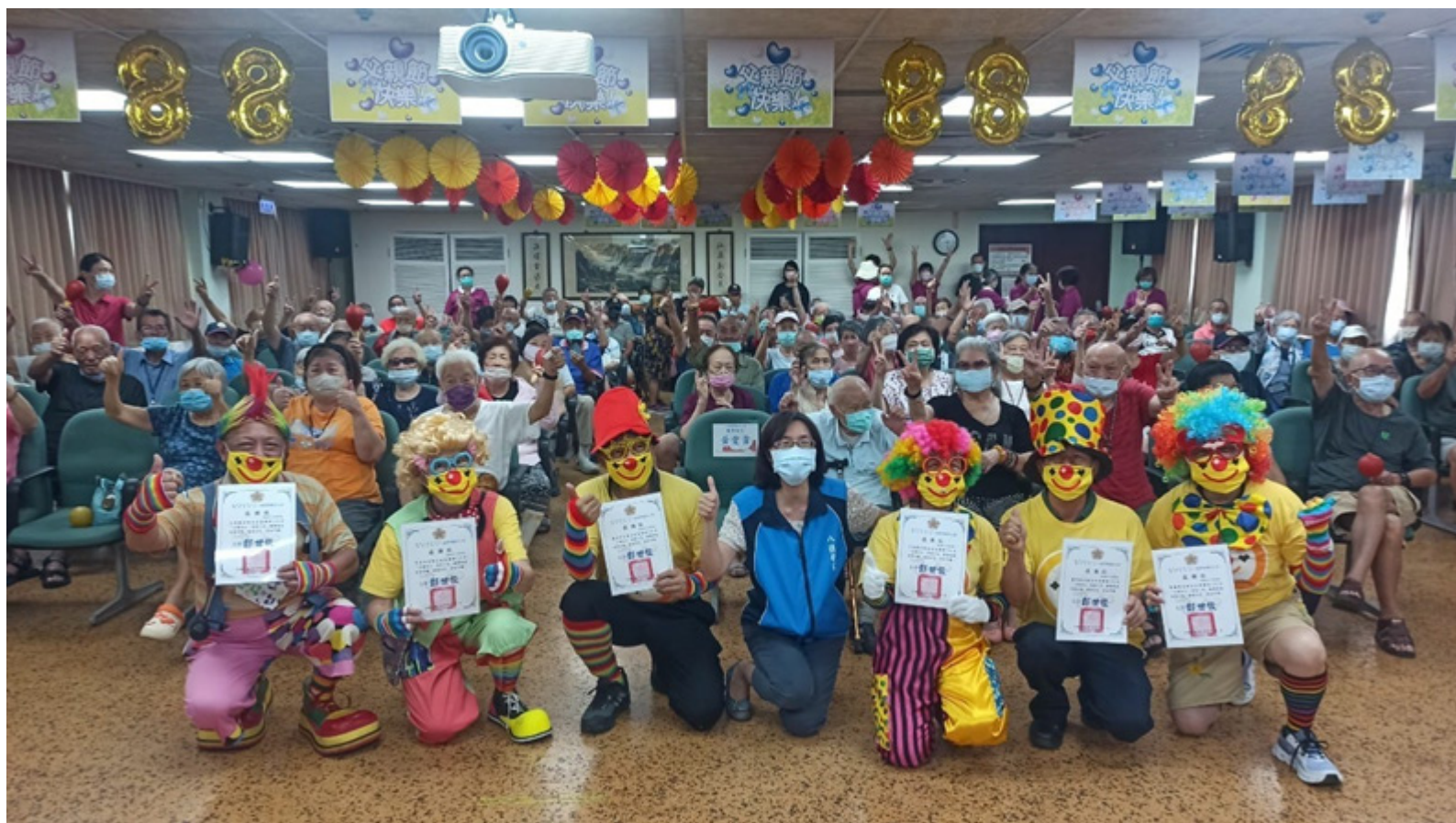
榮家與關懷小丑協會攜手合作辦理「父愛如山，爸氣十足」歡樂氣球派對。

家成為安養、養護及失智照護的綜合型機構，後續配合政府推動行動創新精神，榮家導入智慧照護、AI 規劃概念及失智專業營運照顧服務範疇，逐年編列預算提升及改善環境設施，及配合法規修正增配人力，提升服務照顧品質。