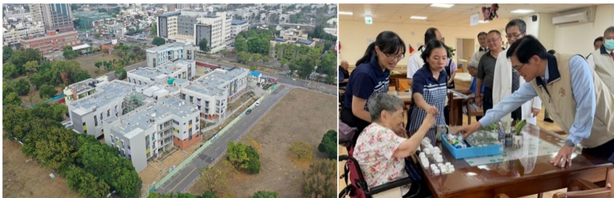
(左) 臺南榮家平實養護園區空拍圖。

網寮北基地新建「網寮北健康園區」，提供安養服務，分夫妻房和單人房兩種房型共 150 床。整體規劃提供活潑、明亮、舒適的環境，採用「簇群式聚落」模式配置，並特別注重人身安全、健康維護、使用便利、居家氛圍等四大需求，以專業化的照顧服務、家庭化的生活照顧及人性化的設計規劃，達到全方位的服務照顧。