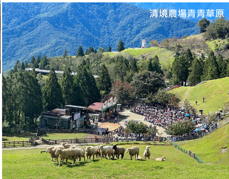
清境農場青青草原

旅遊場所；近年雖受 COVID-19 疫情影響，但平均遊客人數仍達每年 168 萬人次，顯見輔導會農場廣受國內、外遊客喜愛；農場持續推動友善農業措施並擴大與產學合作，提升農產品質與農業技術、開發農特產品及培育專業人才，另透過科技與監測系統協助，強化土地管理。農場將持續塑造自然且兼具在地特色之遊憩環境，提升軟、硬體旅遊服務品質，發展永續友善農業，增加農場經營效能。