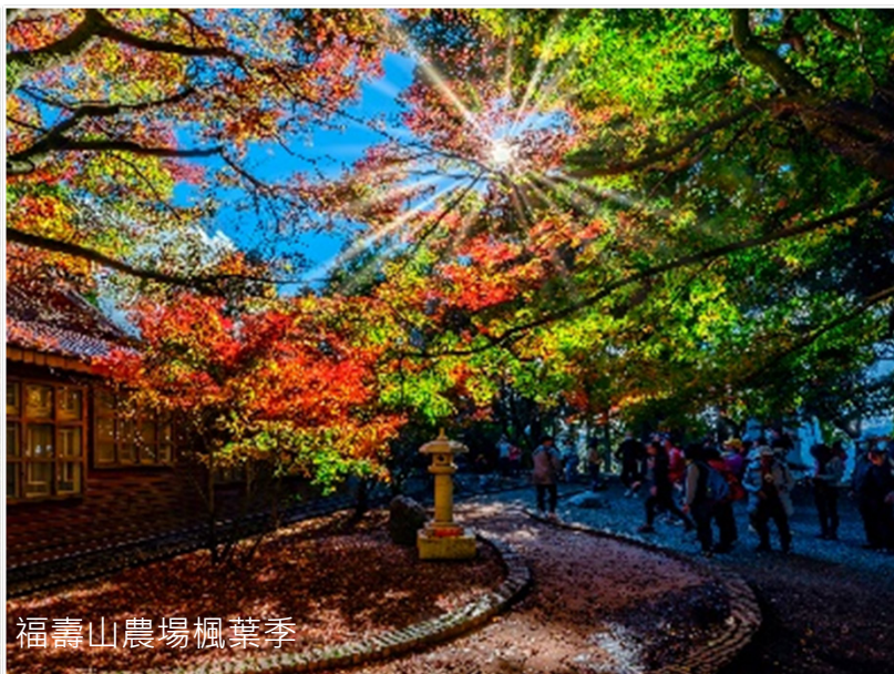
福壽山農場楓葉季