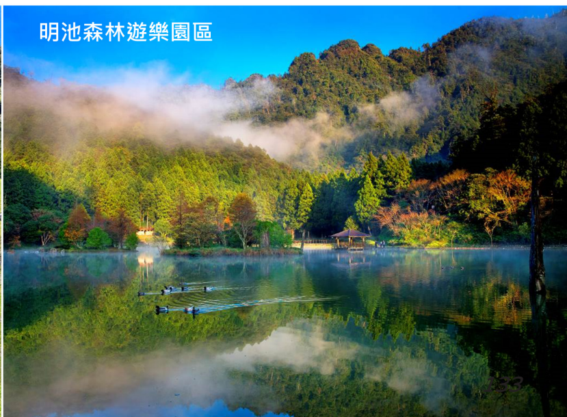
明池森林遊樂園區