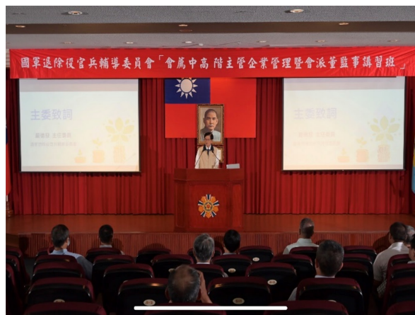
民國 112、113 年企管班上課情形。