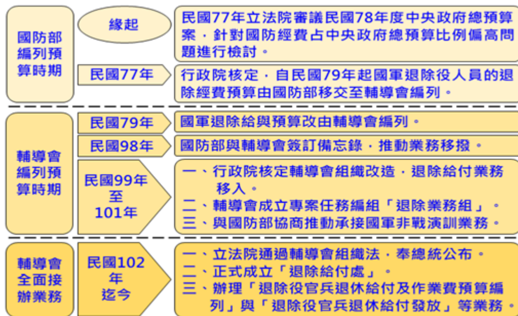
圖 7-1 國軍退除給付業務沿革圖

務組」，專責與國防部協商推動承接業務。同年 7 月，配合行政院組織改造，國防部退除給付業務移入輔導會，民國 102 年 11 月 1 日納入退除給付業務並成立「退除給付處」，專責辦理退除役官兵退休給付預算編列、發放等業務。(圖 7-1) 國軍退除役人員退除經費改輔導會編列，歷年退除給付預算支出占預算約七至八成，民國 110 年至 112 年分別為 78.35%、77.45%、79.88%。(圖 7-2)