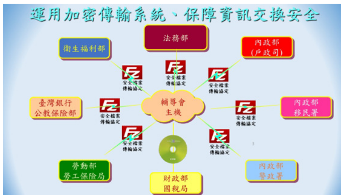
圖 7-3 運用加密傳輸系統圖

為加強查驗及提升資訊安全性，自民國 106 年輔導會與查驗機關（構）導入「資料加密傳輸系統（SFTP, Secure File Transfer Protocol）」，藉 SFTP 加密資訊交換平台與外部查驗機關（構）進行領俸人員資料比對，周全發放退除給與，加強查驗比對密度，運用加密傳輸系統，進行查驗檔案傳輸方式。（圖 7-3）