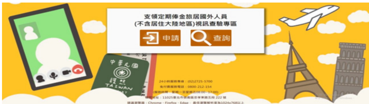
圖 7-5 旅居國外視訊查驗措施