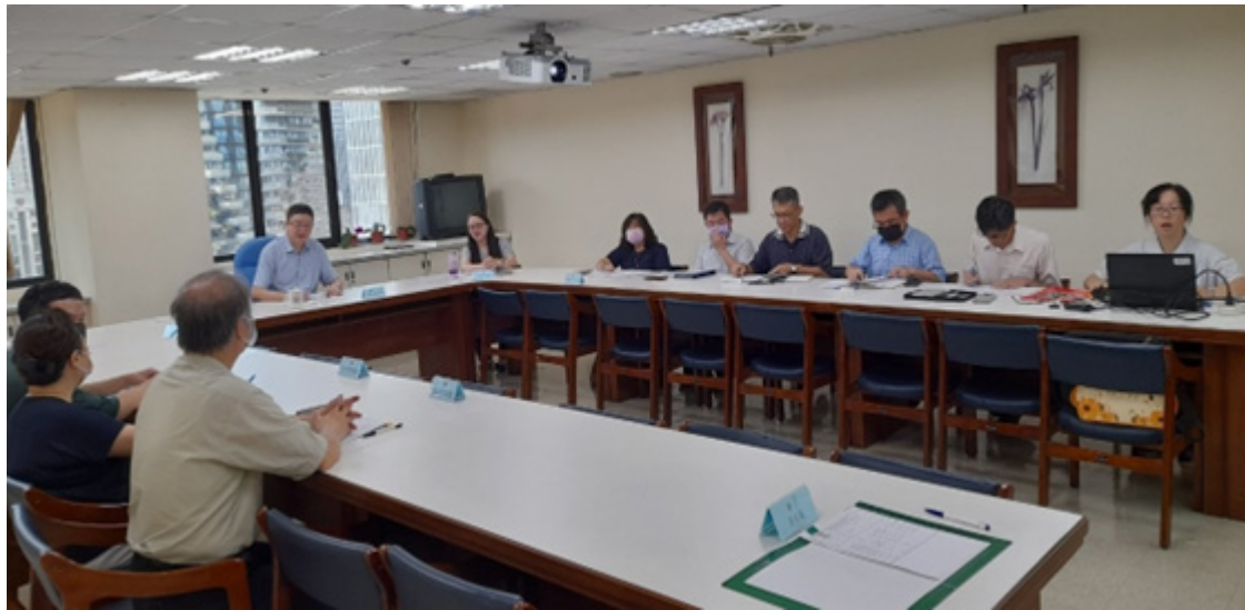
召開工作會議，管控業務執行