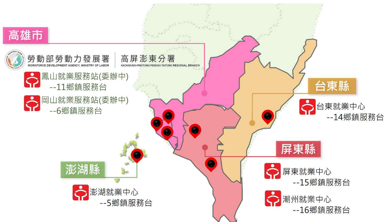
圖 1 高屏澎東分署轄區圖 3

本季報資料置於本分署網站之「訊息中心-政府資訊公開-本分署就業市場報告」網頁內，倘若不盡周全，敬請指教 ( https://kpptr.wda.gov.tw/ )。