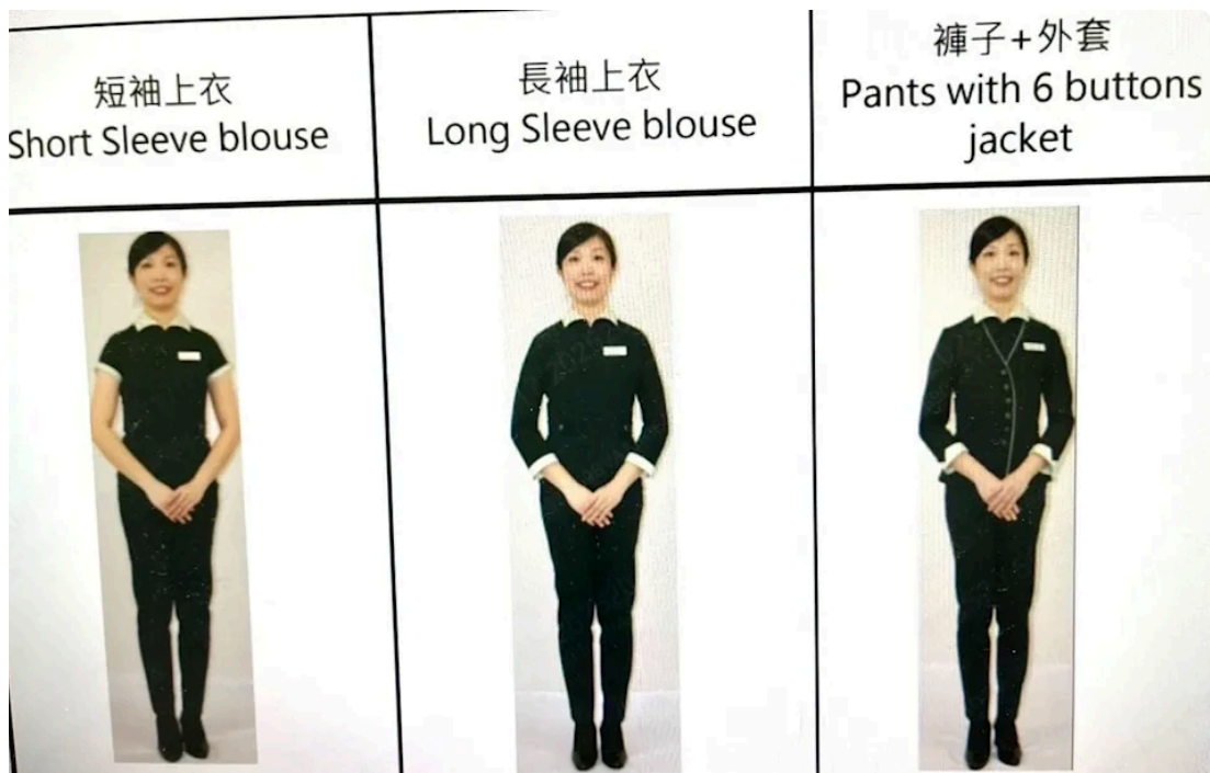
女性空服員自由選擇褲裝或裙裝。

對比目前歐美紐澳地區，有近100%的航空公司提供褲裝選擇，但根據國家人權委員會2024年7月23日的調查報告，目前台灣空服員服儀規範，已經違反「消除對婦女一切形式歧視公約 (CEDAW)」當中有關性別歧視的規定，因此向政府建議應積極履行CEDAW之國家義務，督促國籍航空公司儘速增加女性空服員褲裝制服選項，並協助業者訂定符合性別平等、職業安全、兼具多元民主參與決策機制的服儀規範。