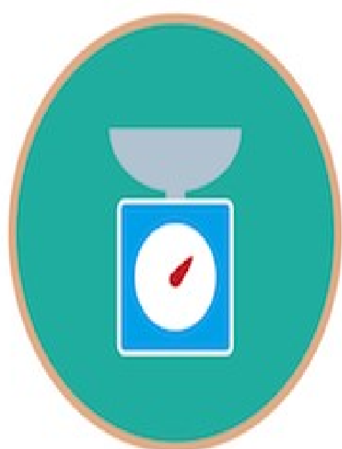
了解一日所需食物份量