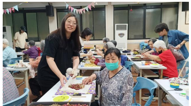
講師教導長輩製作「安神經絡槌」

4 月 24 日榮家舉辦才藝競賽暨嘉年華及 5 月份的慶生會，精心安排了多項趣味遊戲，讓長輩活動筋骨，還能增進彼此的互動與快樂。另精心設計攤位區，邀請清境農場、國軍福利站、社區廠商等設立各式各樣的攤位，讓長輩們在遊戲的同時也能品嚐到美味的食物，現場洋溢著溫馨與愉快的氛圍。