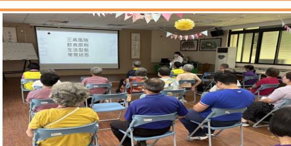
預防三高」健康講座