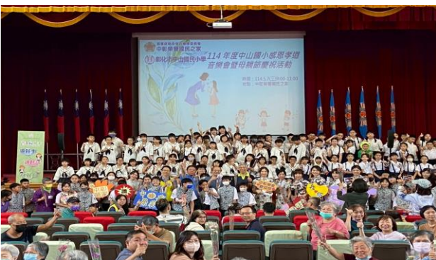
中山國小師生與住民們合影

5月7日彰化市中山國小在中正堂舉辦了一場溫馨的「感恩孝道音樂會暨母親節慶祝動」，以表達對母親無私奉獻的感恩之情。由該校國樂社、口琴社及合唱團，為住民獻上悠揚國樂、和諧口琴樂曲及活潑的帶動唱歌曲，讓長輩們徜徉在愉快的樂聲中，現場充滿感恩、溫馨及歡樂氣氛。也由學生獻上康乃馨，向每一位母親致以最誠摯的感恩，並將這份愛與感動傳達給的所有長輩。