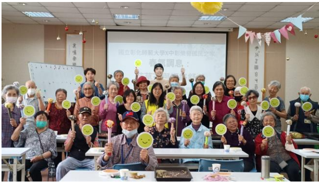
彰師大樂齡療育工作坊

4 月 15 日榮家為豐富長輩精神生活，與國立彰化師範大學合作執行「生態療癒·綠色永續-彰化生態藝術計畫」，由該校美術系師生開辦「春氣調息：花草茶與經絡舒壓」樂齡工作坊。教導住民長輩使用玫瑰等多味中藥製作「安神經絡槌」，如何透過槌揉與品飲溫潤的花草茶，一起感受春日的柔和氣息，釋放身體的緊繃與疲憊。