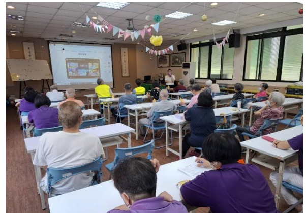
邱副經理分享案例及消費爭議