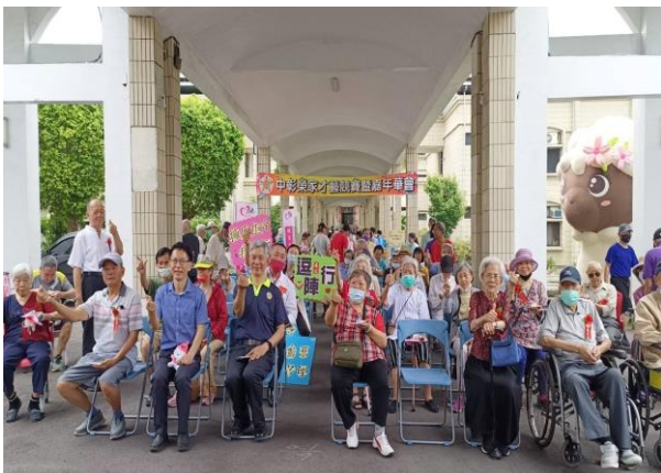
才藝競賽暨嘉年華活動

4 月 24 日榮家舉辦才藝競賽暨嘉年華及 5 月份的慶生會，精心安排了多項趣味遊戲，讓長輩活動筋骨，還能增進彼此的互動與快樂。另精心設計攤位區，邀請清境農場、國軍福利站、社區廠商等設立各式各樣的攤位，讓長輩們在遊戲的同時也能品嚐到美味的食物，現場洋溢著溫馨與愉快的氛圍。