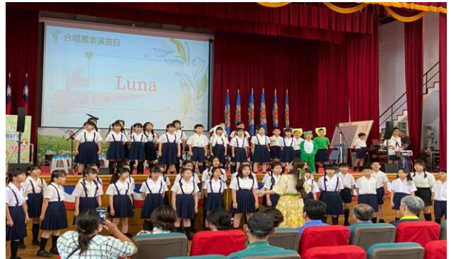
中山國小母親節感恩音樂饗宴