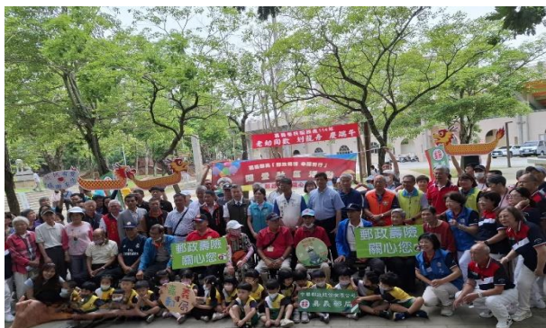
住民參與嘉義榮服處慶端午活動

5 月 26 日由家主任帶領長輩前往嘉義及台南白河等地區微旅行，享受美好的旅遊體驗。首先抵達佔地達 27 公頃的嘉義公園，參與嘉義榮服處舉辦老幼同歡慶端午活動，隨後至台南白河關子嶺風景區的「大仙寺」及水火同源，由家主任親自解說導覽，長輩沉浸在人文薈萃的歷史遺跡、漫步在源遠流長的歷史文化中。