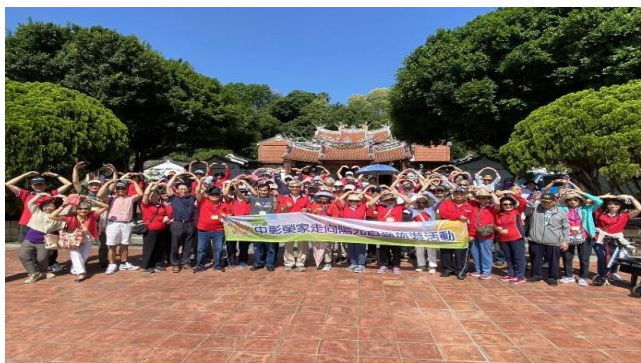
住民參觀彰化寶藏寺

5 月 15 日榮家特別舉辦一場別具意義的自強旅遊與樂齡學習活動，由家主任帶領榮家長輩前往寶藏寺、四面佛寺、台塑生醫觀光工廠及彰化扇形車庫，讓長輩及服務團隊瞭解地方的歷史古蹟，結合觀光產業及當地人文特色，長輩們感謝榮家精心安排本次兼具歷史人文及休閒觀光的豐富行程。