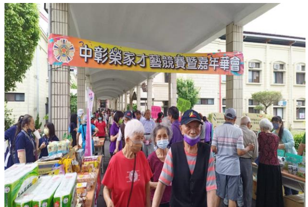
住民參加趣味遊戲及各式攤位