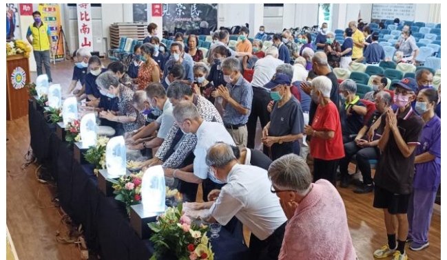
住民們誠心浴佛同沐佛恩

5月7日彰化市中山國小在中正堂舉辦了一場溫馨的「感恩孝道音樂會暨母親節慶祝動」，以表達對母親無私奉獻的感恩之情。由該校國樂社、口琴社及合唱團，為住民獻上悠揚國樂、和諧口琴樂曲及活潑的帶動唱歌曲，讓長輩們徜徉在愉快的樂聲中，現場充滿感恩、溫馨及歡樂氣氛。也由學生獻上康乃馨，向每一位母親致以最誠摯的感恩，並將這份愛與感動傳達給的所有長輩。