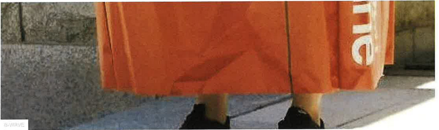
一名女性穿著印有「嬰兒販賣機」的服裝，抗議將女性視為純粹生育工具的觀念。

「4B」源自於四個韓文單字：Bi Yeon-ae（不約會）、Bi Sex（不發生性行為）、Bi Hon（不結婚）以及 Bi Chul-san（不生育）。