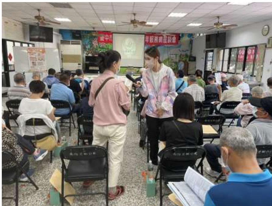
相片主題(1)：衛生局長照中心進行宣導