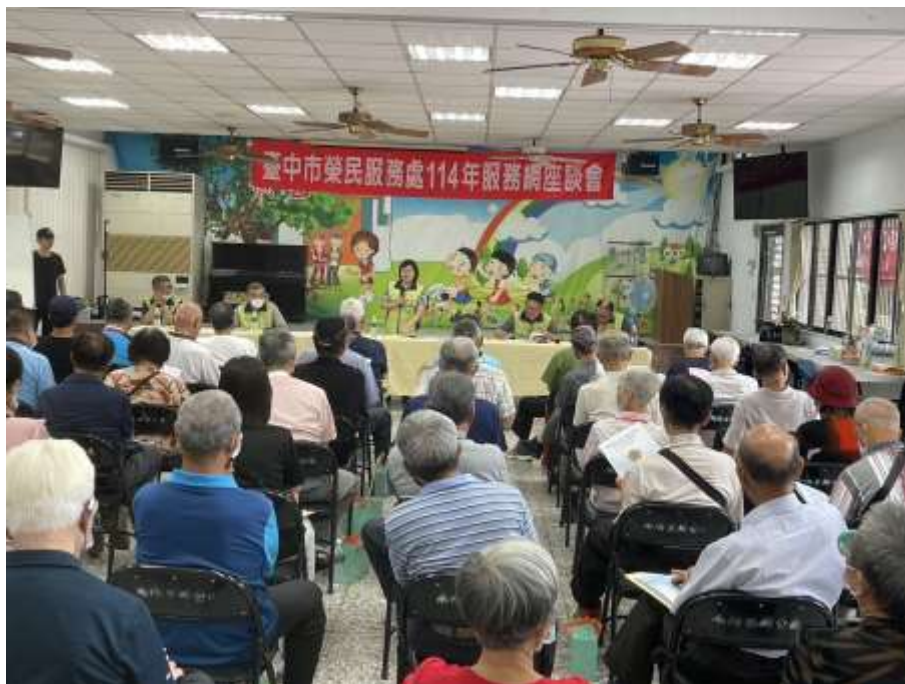
相片主題(3)：副處長主持服務區座談會並回覆榮民提問事項