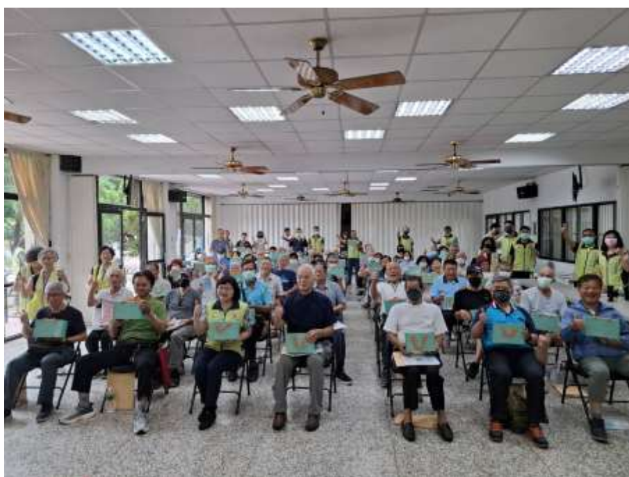
相片主題(4)：全體與會人員合影