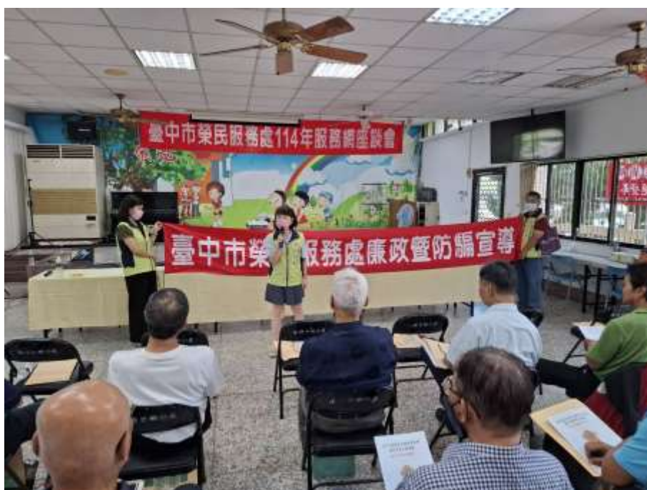
相片主題(2)：本處兼辦政風進行防詐騙宣導