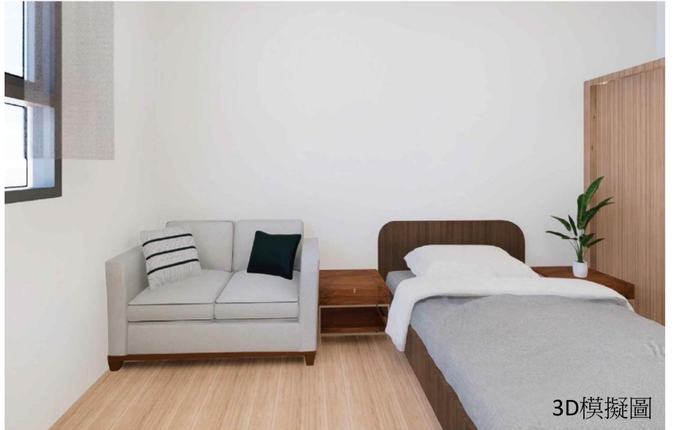
獨立優質的單人套房