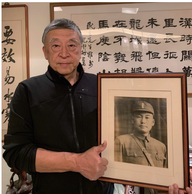
▶ 吉星文將軍是吉民立心目中永遠的英雄。