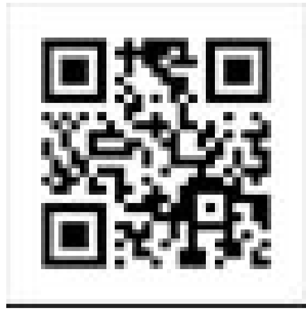
警政服務APP Android 版