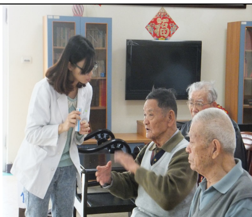
用藥安全衛教宣導