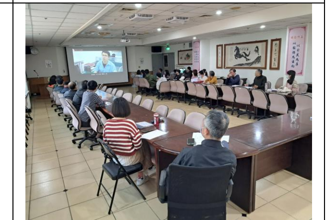
本處 114 年下半年職場霸凌防治宣導教育