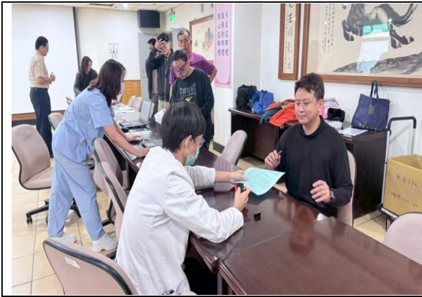
本處 114 年流感疫苗施打作業