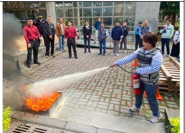
本處 114 年下半年消防講習暨自衛編組演練