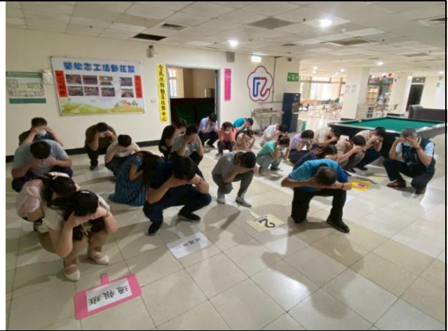
本處 114 年上半年消防講習暨自衛編組演練