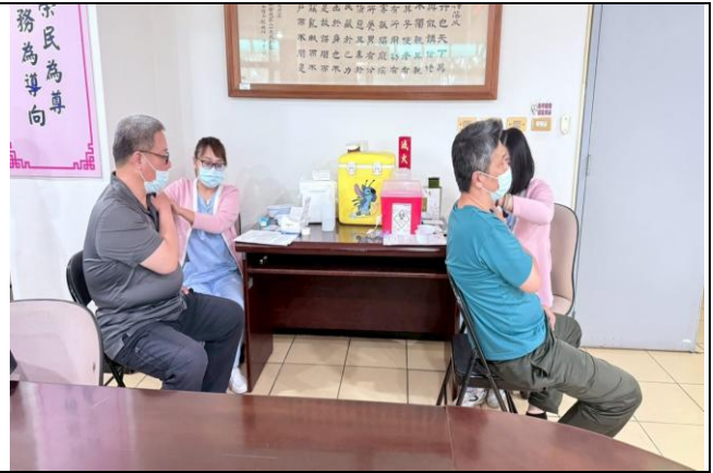
本處 114 年流感疫苗施打作業