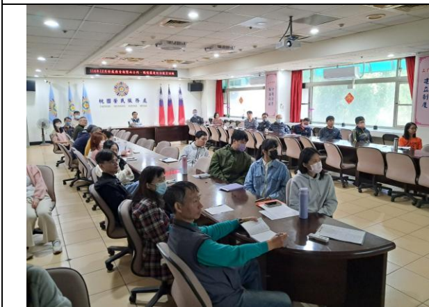
本處 114 年下半年職場霸凌防治宣導教育