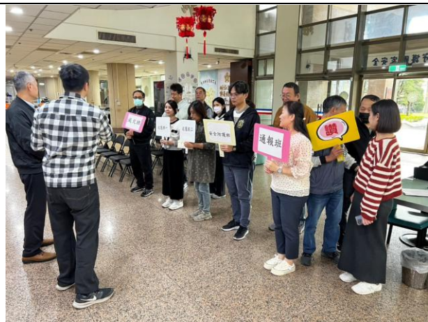
本處 114 年下半年消防講習暨自衛編組演練