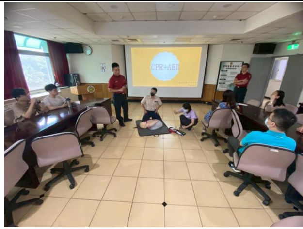
本處 114 年上半年消防講習暨自衛編組演練