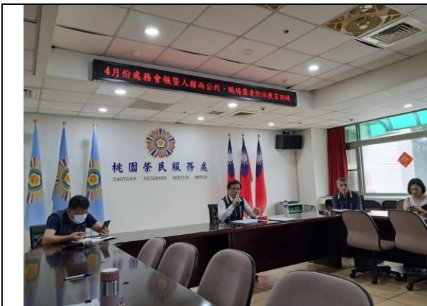
本處 114 年上半年職場霸凌防治宣導教育

為建構健康友善之職場環境及避免員工於執行職務時遭受身體或精神不法侵害，使其安心投入工作，本處業已於 114 年 4 月 23 日、12 月 23 日辦理職場霸凌防治宣導教育，以提升全體員工對職場霸凌的認知及敏感度，建立零容忍的職場文化，並藉由明確的行為準則及暢通申訴管道，預防事件發生，以建構安全和諧及相互尊重之職場環境。